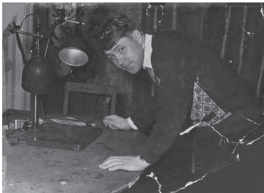
Ленинградский университет. В начале пути