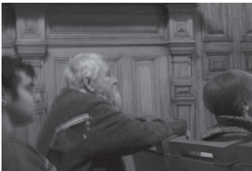
Институт истории материальной культуры, Дубовый зал. Весна 2011 г. Заседание отдела