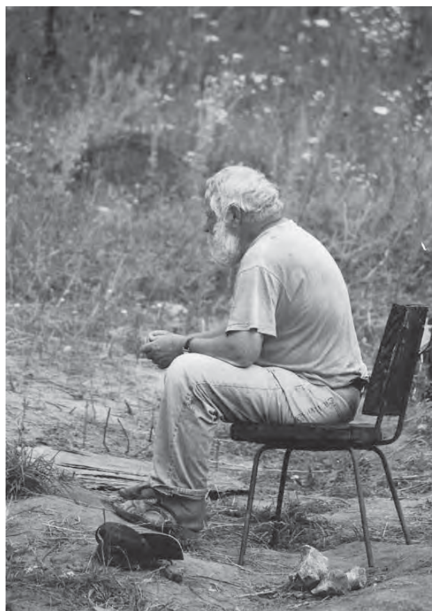
Авдеевская стоянка. Последние годы работы в Авдеево