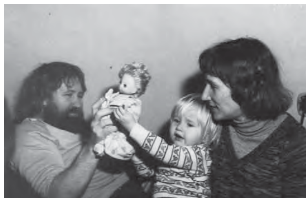
В кругу семьи. Начало 1980-х годов