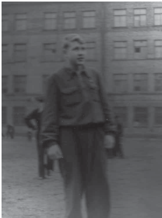
Ленинград. Школьник старших классов