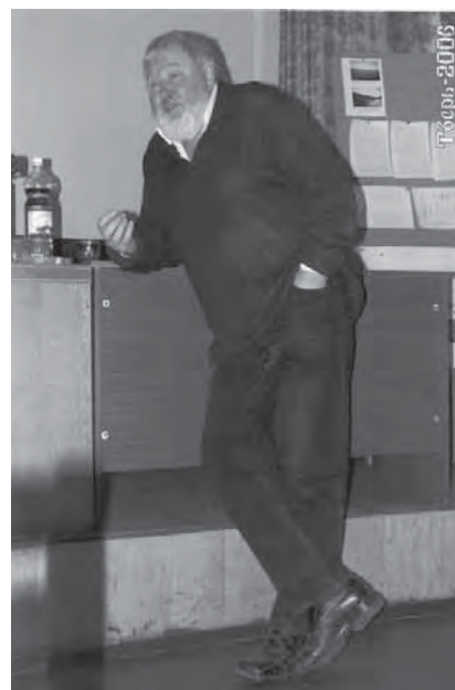
Выступление на Тверской конференции, 2006 г.