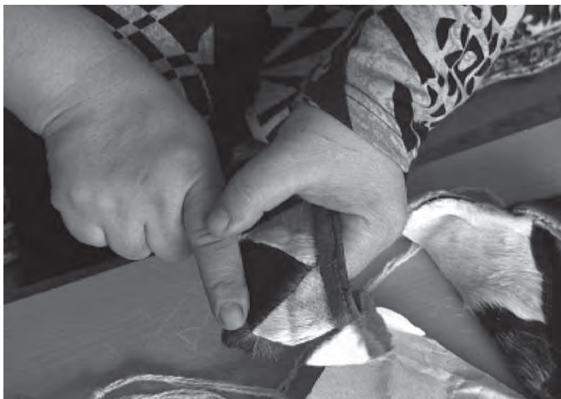
Рис. 3. Г. А. Улэ. Фото из видеозаписей автора, 2013 г. (AKU-13-12-03)