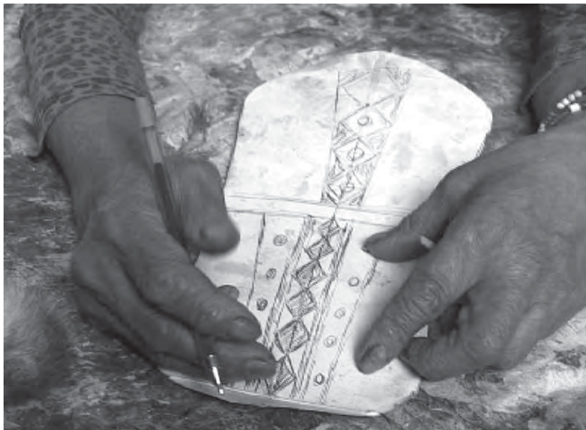
Рис. 6. Н. И. Коялкот. Фото из видеозаписей автора, 2013 г. (AKU-13-10-01)