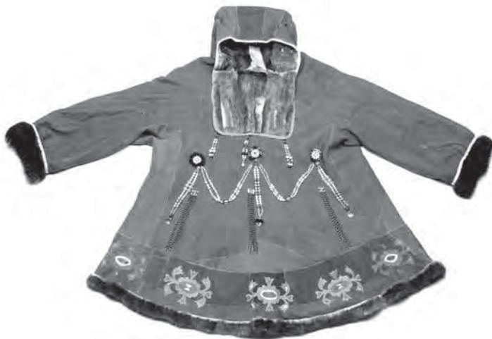
Рис. 12. Кухлянка, мастерица Т. М. Хупки. Тилички. Год изготовления: 2002. Коллекция Фонда культуры народов Сибири, Фюрстенберг