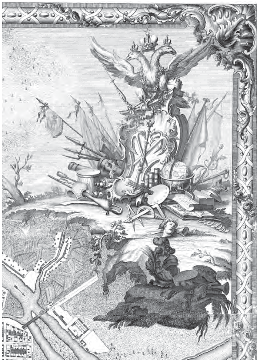
Рис. 8. Верхний картуш «Плана столичного города Санкт-Петербурга...» 1753 г. По рисунку М. И. Махаева