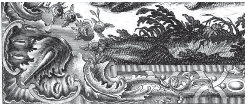
Рис. 2. Надпись на гравюре, обозначающая роль И. Ф. Трускотта в создании «Плана столичного города Санкт-Петербурга...» 1753 г.

Подобная надпись о Махаеве — там же, на гравюре, под нижней кромкой барочной рамы, — гласит: «Литеры грид[оровали]... художники под смотр[ением] подмастерья М. Махаева» (рис. 3). Очевидно, из этих данных и исходит С. В. Семенцов, когда пишет об участии Махаева: «Выполнил на плане только надписи » (удивительным образом игнорируя при этом значение стоящего здесь же, под рамой, определения роли Трускотта).