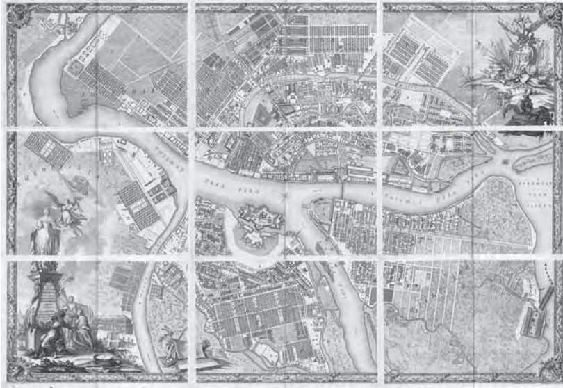
Рис. 1. «План столичного города Санкт-Петербурга с изображением знатнейших оного проспектов, изданный трудами Императорской Академии наук и художеств в Санкт-Петербурге». Составители: И. Ф. Трускотт и другие. Художники: М. И. Махаев и другие. Граверы Академии наук под руководством С. И. Соколова. 1753 г.

плана был топограф и картограф И. Ф. Трускот», — аргументирует С. В. Семенцов 4 .