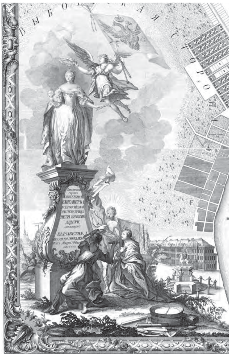
Рис. 7. Нижний картуш «Плана столичного города Санкт-Петербурга...» 1753 г. По рисунку М. И. Махаева (?)