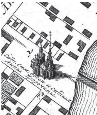
Рис. 6. Аксонометрическое изображение храма Семиона и Анны на «Плане столичного города Санкт-Петербурга...» 1753 г. По рисунку М. И. Махаева (?)

Заметим, что наличие аксонометрий выделяет академический план 1753 г. как среди предыдущих планов Петербурга, так и последующих (лишь «План Сент-Илера-Горихвостова-Соколова» стал незавершенной попыткой полностью аксонометрической планографии новой российской столицы), включает его в традицию подобных изображений на планах европейских городов, средневековых и Нового времени, а в некотором смысле отсылает и к физиограммам на русских допетровских чертежах.