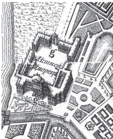
Рис. 5. Аксонометрическое изображение Летнего дворца императрицы Елизаветы Петровны на «Плане столичного города Санкт-Петербурга...» 1753 г. По рисунку М. И. Махаева (?)