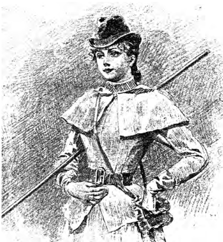
Е.П. Самокиш-Судковская. Норвежская девушка-туристка. Гл. 4. Нордкап и Нордкин. Т. II. Изд. «По Белу-Свету»

Второй том очерков, содержащий описание различных сфер жизни других скандинавских стран — Швеции и Норвегии, также украшают рисунки Самокиш-Судковской и ее мужа. Эта работа потребовала от художников внимательного изучения материалов путешествий и фантазии. Несмотря на то что в 1870 г. столица Великого княжества Финляндского Гельсингфорс была соединена железнодорожной веткой с Санкт-Петербургом, немногие художники бывали в скандинавских странах, особенно в столь отдаленных местах, которые описывал доктор Елисеев. Некоторые рисунки были сделаны по зарисовкам путешественника. Он был неплохим рисовальщиком и предоставил художникам свои наброски, выполненные во время экспедиций, целью которых было посещение других стран для изучения их в антропологическом, этнографическом и медицинском аспектах.