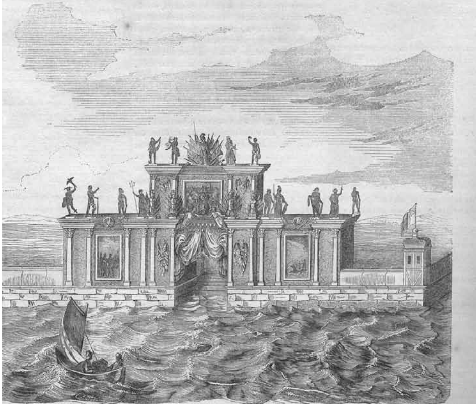
Рис. 2. Триумфальные ворота на Неве в 1714 г. Гравюра Л. Серякова для журнала «Иллюстрация» (1846. № 28)

— Я влюбленъ въ замужнюю и продолжалъ я въ какомъ то самозащитѣ чуть не грѣшу противъ совѣти рываю это вѣжное существо изъ кого то стараго ревнивца, какаго