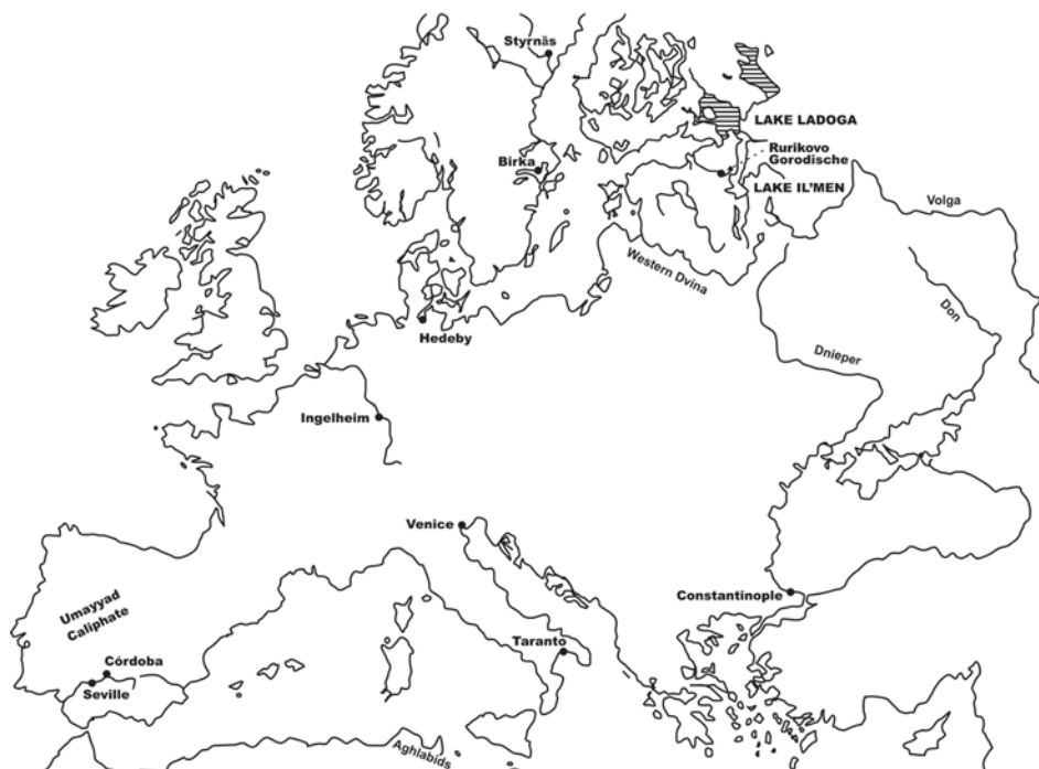
Рис. 3. Находки редчайших монет императора Феофила, согласно гипотезе Шепарда, отмечают обратный путь посольства русов, прибывших вместе с послами императора Феофила в 839 г. ко двору Людовика Благочестивого (Ингельгейм, Хедебю, Стюрнас, Бирка, Рюриково городище) 50

согласно мнению Крамлин-Петерсена, ко времени появления фризских судов типа ког 52 — к IX в. 53 Топонимы с элементом “ kugg ” отмечены в Ботническом заливе. Одна из бухт Бирки носит название Kugghamn , и хотя нет доказательств раннего происхождения этого топонима, тем не менее это лишнее подтверждение связей Бирки с Дорестадом и Фризией. Есть указания на то, что именно Рёрик Фрисландский использовал для обороны побережья Фризии местные суда типа ког 54 .