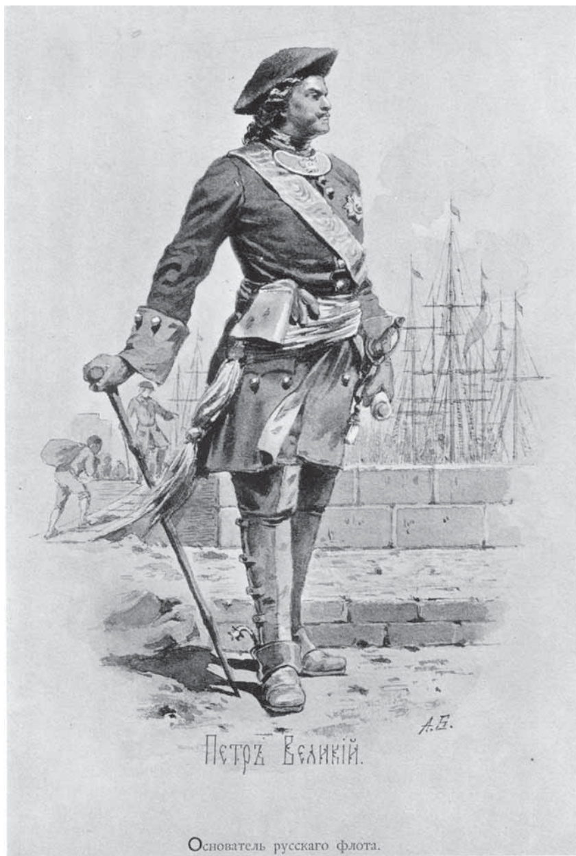
Рис. 3. Изображение Петра I в книге «Просветители России»