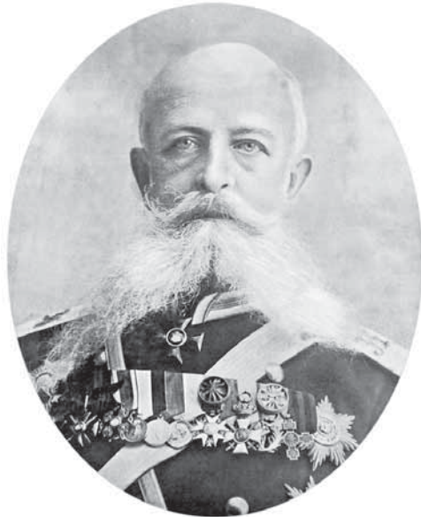
Рис. 1. Александр Александрович фон Бильдерлинг

Публикация статьи, посвященной обзору художественной деятельности генерала А.А. Бильдерлинга (рис. 1), в сборнике «Немцы в Санкт-Петербурге: Биографический аспект. XVIII–XX вв.» в 2013 г. 1 не исчерпала интереса к изучению его наследия. Ряд архивных материалов остался еще невыявленным. Без особого внимания исследователей хранятся в музейных собраниях рисунки Бильдерлинга, пока они не систематизированы, а часть зарисовок еще не обнаружена. На данном этапе не представляется возможным более детально проследить факты работы Бильдерлинга над проектами памятников и монументов, созданных по его рисункам скульптором И.Н. Шредером.