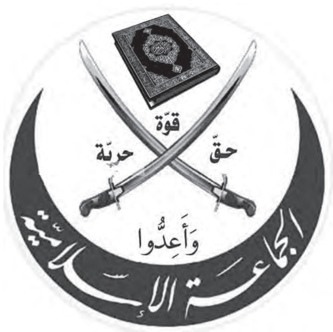
Рис. 4. Коран и скрещенные мечи. Логотип Ассоциации братьев-мусульман.

Борьба за независимость Индии, попытка сохранить от раскола по религиозному принципу это великое многонациональное и многоконфессиональное государство нашли свое отражение в тафсире Мауланы Абу-л-Калама Азада (1888–1958). Резко отличную, узкоконфессиональную, позицию представляли труды двух других индийских мусульманских теологов и публицистов — Абу-л-‘Ала’ ал-Маудуди (1903–1979) и Абу-л-Хасана ан-Надви. Последние во многом оказали влияние на развитие взглядов идеолога египетских «братьев-мусульман» (рис. 4) Сайида Кутба.