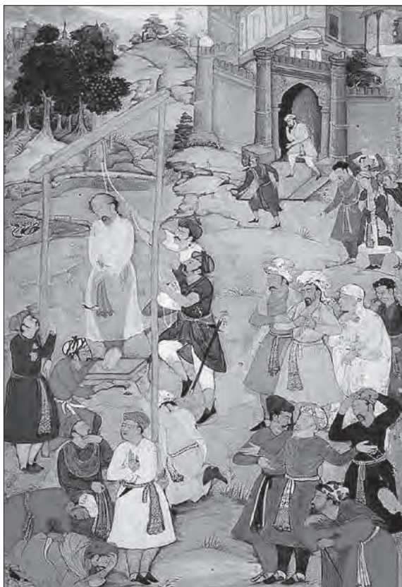
Рис. 3. Казнь ал-Халладжа.

Основанный на принципе «предание ( сунна ) разъясняет Коран», труд ат-Табари стал важнейшим достижением направления исламской экзегетики, которое получило название «толкование с помощью традиции».