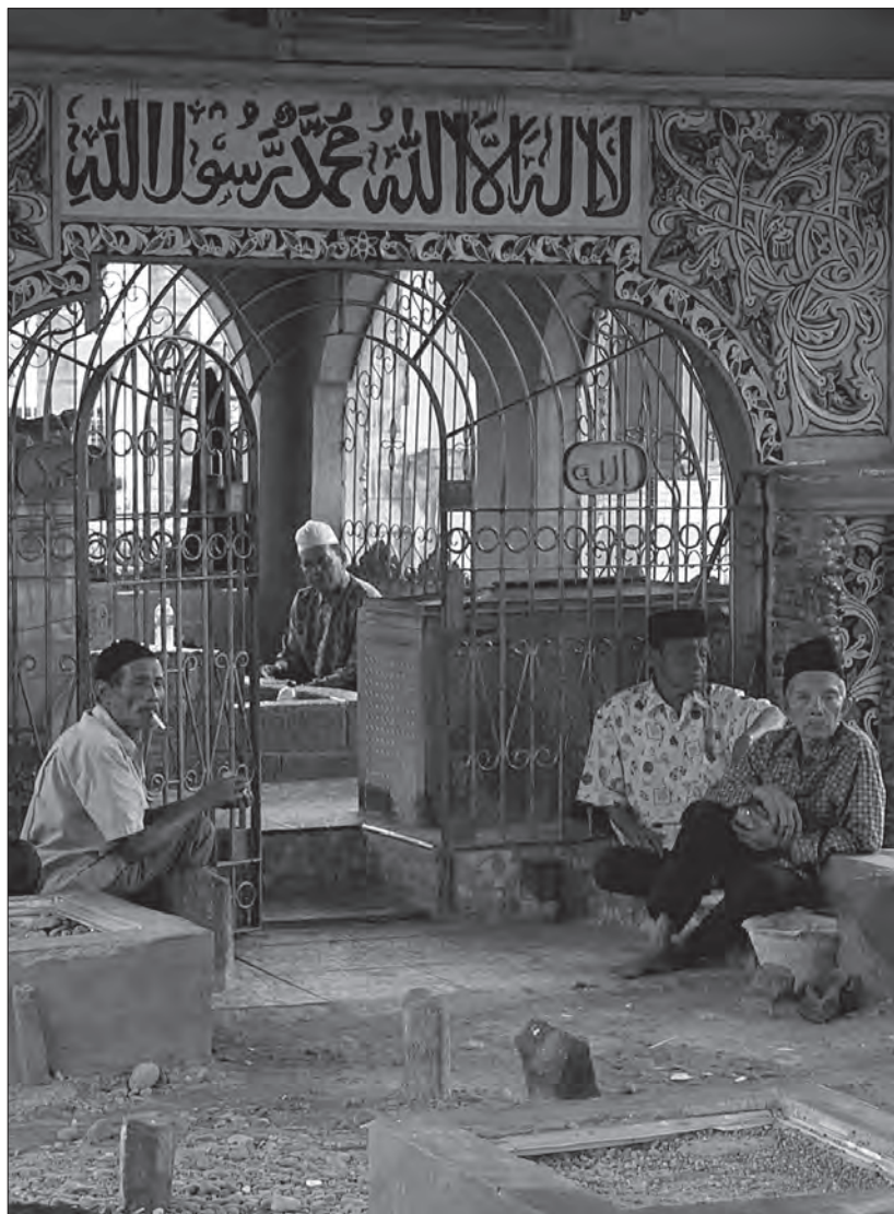
Рис. 1. Молящиеся у входа во внутренний мавзолей шейха Бурхан ад-Дина (1649–1692), суфийского подвижника, принадлежавшего к братству шатарийя и обратившего минангка-бау в ислам. Улакан, Западная Суматра, 2013 г.