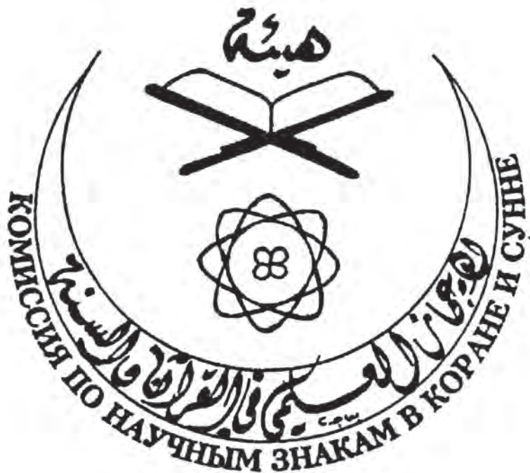
Рис. 5. Логотип Комиссии по научным знакам в Коране и сунне.

посредством которой сообщения об этих достижениях были зашифрованы. В одном и том же айате (например, 81:6: «И когда моря перельются») видят предсказание об извержении вулкана Кракатау, случившемся в 1883 г. (М. 'Абдо), и пророчество о водородной бомбе. В октябре 1957 г., сразу же после запуска первого советского спутника, в Каире по инициативе журнала «Лива' а-ислам» прошел симпозиум на тему «Спутник и Коран», где утверждалось, что космические полеты были предсказаны айатом 55:33. В Коране находят и указание на теорию расширения Вселенной (51:47, 21:31), и подтверждение гелиоцентрической системы Коперника (36:38, 40), и указание на закон сохранения энергии (55:8), и многое-многое другое.