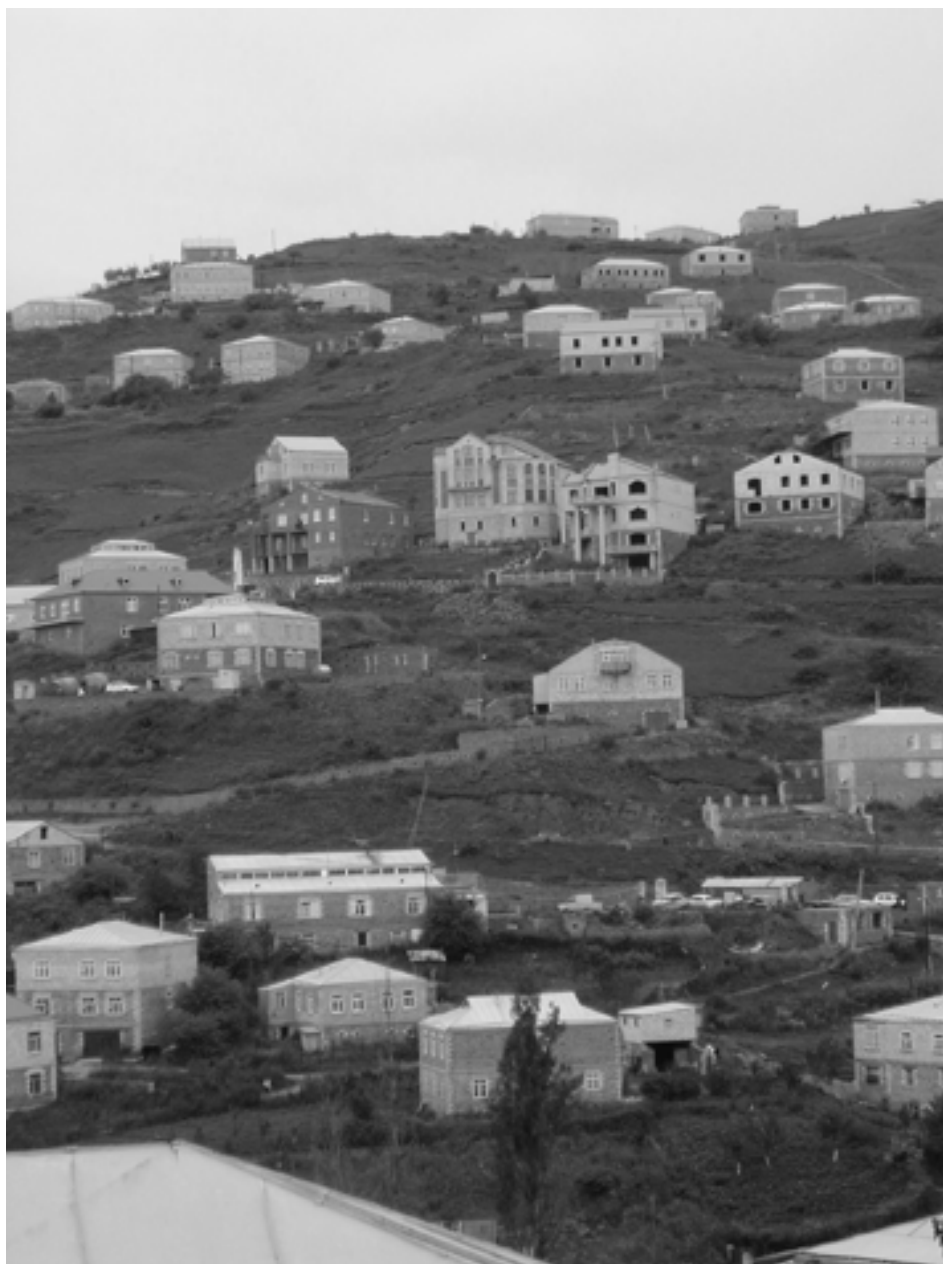
Новый квартал Кубачей. 2009 г.

На протяжении XX столетия, особенно второй его половины, очень многое изменилось в жизни гор и горцев. Можно сказать, горский мир перевернулся на 180 градусов. Ныне значительная, а то и большая часть населения горных районов Дагестана проживает в равнинных районах республики и за ее пределами. Это переселенцы 20—70-х гг. XX в., организованно вовлеченные в соответствующий процесс государством, и их дети и внуки, а также пе-