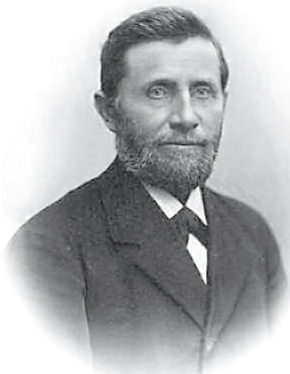
Рис. 1. Ингвар Людвиг Номменсен — первый христианский миссионер (1834—1918)

домах наряду с фотографиями, запечатлевшими членов семьи или важные события в их жизни, прежде всего свадьбу.