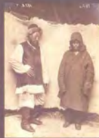
8. "Men's folk costume", Photo by Samuel Dudin, Kazakhstan, 1899. Watercolour over the photographic print, 9,1 × 23,2 cm, MAE RAS, No. 1200-500 (source photo No. 1199-195, 17,0 × 24,2 cm).