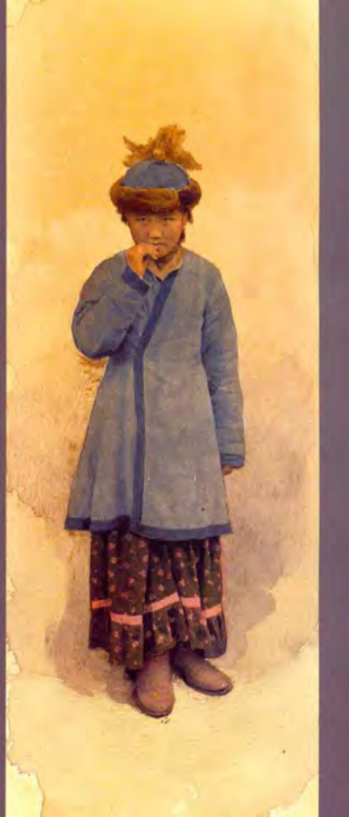
1. «Юстном девочки». Фотограф С. М. Дудин. Казахстан, 1899 г. Акварель по фотоотпечатку, 8,0 × 23,0 см. МАЗ РАН, № 1199–34–P2 (исходный фотоотпечаток № 1199–34–P1, 12,3 × 17,6 см).