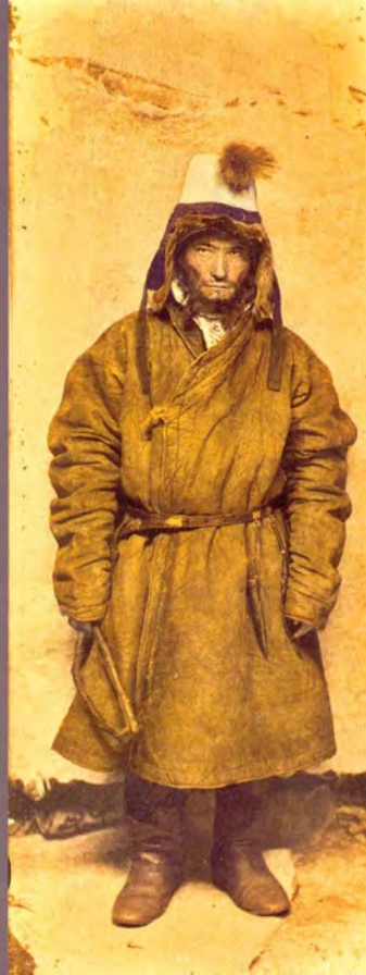
9. "Men's folk costume", Photo by Samuel Dudin, Kazakhstan, 1899. Watercolour over the photographic print, 8,2 × 22,7 cm, MAE RAS, No. 1200-499 (source photo No. 1199-190, 17,4 × 23,8 cm).