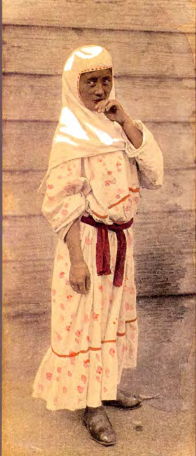
12. «Костюм замужней женщины — рубаха, кимिशек и пояс». Фотограф С. М. Дудин. Казахстан, 1899 г. Акварель по фотоотпечатку, 9,4 × 23,3 см. МАЭ РАН, № 1199-256-P2 (исходный фотоотпечаток № 1199-256-P1, 16,7 × 23,2 см).

12. "Folk costume of a married woman — shirt-dress, kimishek and waistband". Photo by Samuel Dudin. Kazakhstan, 1899. Watercolour over the photographic print, 9.4 × 23.3 cm. MAE RAS, No. 1199-256-P2 (source photo No. 1199-256-P1, 16.7 × 23.2 cm).