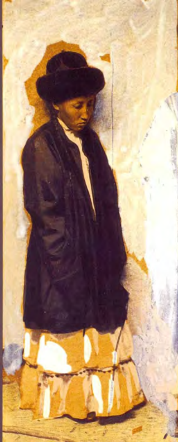
6. «Девушка в традиционном костюме». Фотограф С. М. Дудин. Казахстан, 1899 г. Акварель по фотоотпечатку, 6,8 × 17,8 см. МАЭ РАН, № 1200-501 (исходный фотоотпечаток № 1199-211, 12,0 × 18,0 см).

6. "Girl in a folk costume". Photo by Samuel Dudin. Kazakhstan, 1899. Watercolour over the photographic print, 6.8 × 17.8 cm. MAE RAS, No. 1200-501 (source photo No. 1199-211, 12.0 × 18.0 cm).