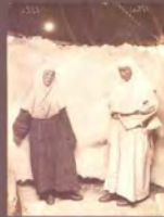
13. «Женский костюм — цветной койлек». Фотограф С. М. Дудин. Казахстан, 1899 г. Акварель по фотоотпечатку, 9,3 × 23,2 см. МАЭ РАН, № 1200-496 (исходный фотоотпечаток № 1199-186, 17,3 × 23,5 см).

13. "Folk costume of a woman — colour koylek ". Photo by Samuel Dudin. Kazakhstan, 1899. Watercolour over the photographic print, 9.3 × 23.2 cm. MAE RAS, No. 1200-496 (source photo No. 1199-186, 17.3 × 23.5 cm).