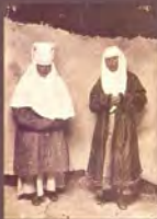
17. «Сырмак». Фотограф С. М. Дудин. Казахстан, 1899 г. Акварель по фотоотпечатку, 11,8 × 17,5 см. МАЭ РАН, № 1199-223-P2 (исходный фотоотпечаток № 1199-223-P1, 12,4 × 17,3 см).