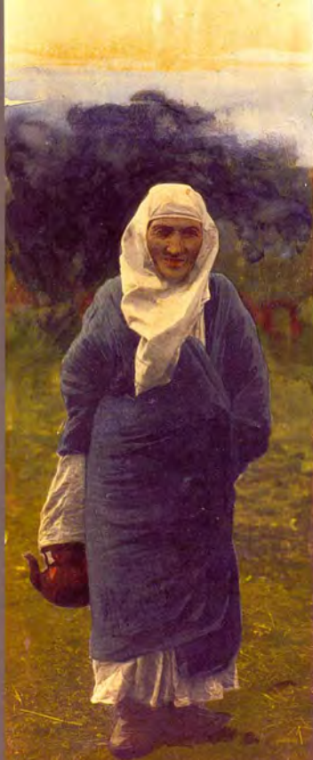
4. «Пожилая бедная женщина в традиционном костюме». Фотограф С. М. Дудин. Казахстан, 1899 г. Акварель по фотопечатку. 8,5 × 22,7 см. МАЭ РАН, № 1199-10-P2 (исходный фотоотпечаток № 1199-10-P1, 16,8 × 23,7 см).

4. "Old poor woman in folk costume". Photo by Samuel Dudin. Kazakhstan, 1899. Watercolour over the photographic print. 8.5 × 22.7 cm. MAE RAS, No. 1199-10-P2 (source photo No 1199-10-P1, 16.8 × 23.7 cm).