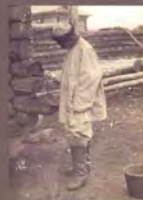
5. «Мужской костюм — рубаха, штаны, сапоги». Фотограф С. М. Дудин. Казахстан, 1899 г. Акварель по фотопечатку, 10,8 × 17,2 см. МАЭ РАН, № 1199-27-P2 (исходный фотоотпечаток № 1199-27-P1, 12,0 × 17,1 см).

5. "Men's folk costume — shirt, trousers, high boots". Photo by Samuel Dudin. Kazakhstan, 1899. Watercolour over the photographic print, 10.8 × 17.2 cm. MAE RAS, No. 1199-27-P2 (source photo No 1199-27-P1, 12.0 × 17.1 cm).