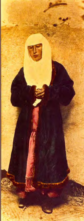
16. «Богатая казашка в дорожном костюме». Фотограф С. М. Дудин. Казахстан, 1899 г. Акварель по фотоотпечатку, 8,3 × 22,7 см. МАЭ РАН, № 1200-497 (исходный фотоотпечаток № 1199-188, 16,8 × 24,1 см).