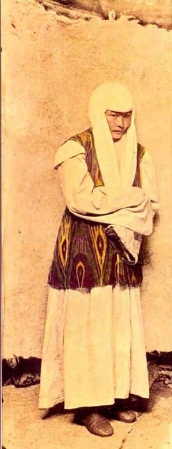
10. «Костюм богатой казашки — камзол, ситцевая рубаха и на голове кимишек». Фотограф С. М. Дудин. Казахстан, 1899 г. Акварель по фотоотпечатку, 8,1 × 21,9 см. МАЭ РАН, № 1199-194-Р3 (исходный фотоотпечаток № 1199-194-Р1, 17,2 × 23,8 см).

10. "Folk costume of a rich Kazakh woman — sleeveless jacket, cotton shirt, and kymishek on the head". Photo by Samuel Dudin. Kazakhstan, 1899. Watercolour over the photographic print, 8.1 × 21.9 cm. MAE RAS, No. 1199-194-P3 (source photo No. 1199-194-P1, 17.2 × 23.8 cm).