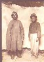
7. «Мужской костюм». Фотограф С. М. Дудин. Казахстан, 1899 г. Акварель по фотоотпечатку, 9,2 × 23,2 см. МАЭ РАН, № 1200-498 (исходный фотоотпечаток № 1199-189, 17,2 × 23,8 см).

7. "Men's folk costume". Photo by Samuel Dudin. Kazakhstan, 1899. Watercolour over the photographic print, 9.2 × 23.2 cm. MAE RAS, No. 1200-498 (source photo No. 1199-189, 17.2 × 23.8 cm).