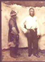
14. «Мужской костюм — камзол с короткими рукавами и тельпак на голове». Фотограф С. М. Дудин. Казахстан, 1899 г. Акварель по фотоотпечатку, 9,3 × 22,9 см. МАЭ РАН, № 1199-193-P3 (исходный фотоотпечаток № 1199-193-P1, 17,2 × 24,3 см).

14. "Men's folk costume — sleeveless jacket and a telpak on the head". Photo by Samuel Dudin. Kazakhstan, 1899. Watercolour over the photographic print, 9.3 × 22.9 cm. MAE RAS No. 1199-193-P3 (source photo No. 1199-193-P1, 17.2 × 24.3 cm).