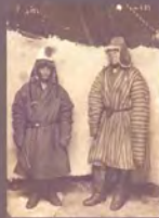
9. «Мужской костюм». Фотограф С. М. Дудин, Казахстан, 1899 г. Акварель по фотоотпечатку, 8,2 × 22,7 см, МАЭ РАН, № 1200-499 (исходный фотоотпечаток № 1199-190, 17,4 × 23,8 см).