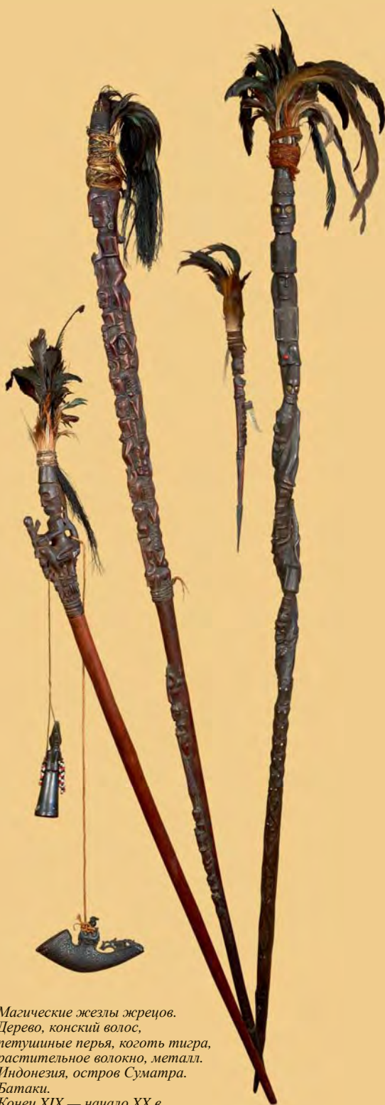
► Магические жезлы жрецов. Дерево, конский волос, пегушиные перья, коготь тигра, растительное волокно, металл. Индонезия, остров Суматра. Батаки. Конец XIX — начало XX в.

Жезлы, представленные на экспозиции, поступили в Музей в конце XIX — начале XX в.