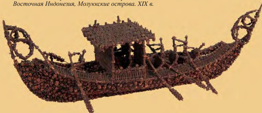
▼ Лодка. Модель. Бутоны гвоздичного дерева. Восточная Индонезия, Молуккские острова. XIX в.

Экспонат поступил в Музей в 80-х годах XIX века.