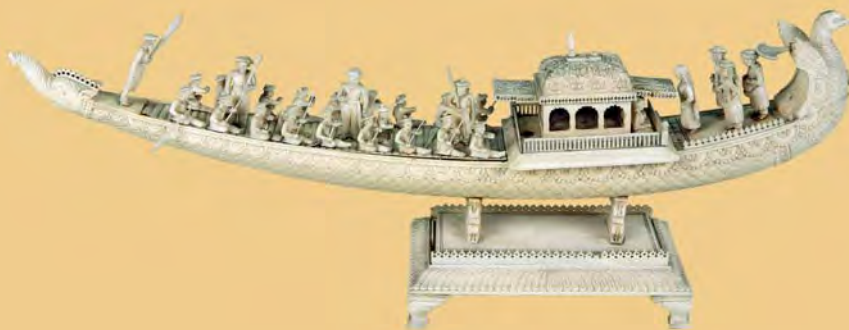
▼ Лодка. Слоновая кость. Восточная Индия. Бенгальцы. Начало XX в.

По религиозным установлениям, слонов нельзя убивать, поэтому их всегда держали в заповедниках, отлавливали и отпиливали бивни. Бивни привозят также из Африки; они менее ломкие и желтые, чем у индийских слонов. Кость размягчают паром, распиливают и обрабатывают с помощью ножей, напильников и кисточек. Готовые изделия полируют меловым порошком или шероховатой толстой жилкой листа хлебного дерева.