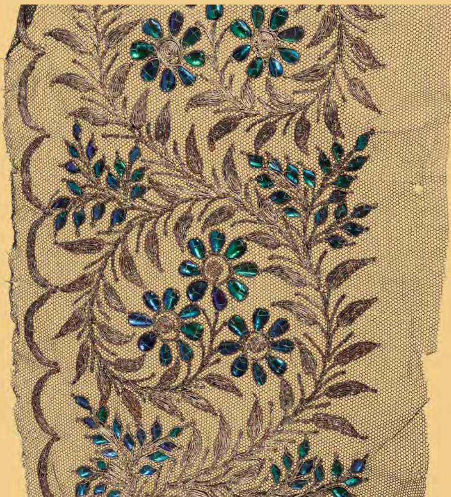
▲ Образец вышивки надкрыльями тропических жуков и золотной нитью по тюлю. Тюль, крылья жучков, нить золотная калабатун. Северная Индия. XIX—XX вв.

Гладкие, без рисунка, ткани украшают и отделывают красильщики, набивщики или вышивальщицы. Для вышивания тканей используются не только нити, в том числе металлические, но и такие своеобразные материалы, как кусочки зеркала, слюды, бисер, металлические бляшки и даже надкрылья тропических жуков. Большую роль в индийской одежде играют серебряные и золотые нити. Обычно их куют из чистого серебра и золота, а потом протягивают через несколько отверстий, постепенно сужающихся до тонкости волоса. Часто вышивка оказывается не только средством украшения ткани, но и способом ее скрепления. Иногда она заменяет узорчатое тканье.