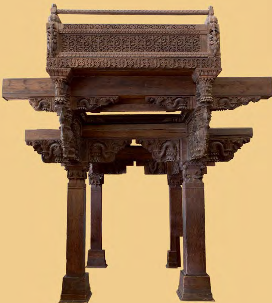
▲ Часть дворцовой террасы. XVIII в.

Резной портик из тикового дерева сохранился от дворца XVIII в. Хингнас-вара, что значит «Дворец целебной смолы и нюхательного табака». Он принадлежал пешвам , наследственным премьер-министрам одного из индийских государств, Махараштры (ныне — штат Республики Индия).