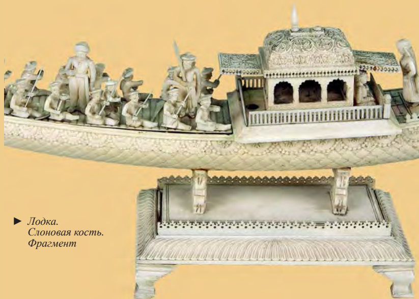
► Лодка. Слоновая кость. Фрагмент

Искусство обработки слоновой кости сохраняется в Индии с древности до наших дней. Резчики вырезали рукоятки мечей, ручки опахал и царских зонтов, изображения божеств и алтари. Костью отделявали троны, ложа, паланкины, надвратные украшения и другие предметы. Костяными пластинами инкрустировали музыкальные инструменты, оружие, ширмы, шкатулки. Вырезали также жанровые сцены, как эта парадная лодка с гребцами. Костяные вещи высоко ценились среди знати и состоятельных горожан, а также шли на экспорт: в странах Запада они считались предметами роскоши. В настоящее время спрос на них упал, и резчики делают в основном женские украшения, мелкие сувениры и бытовую утварь.