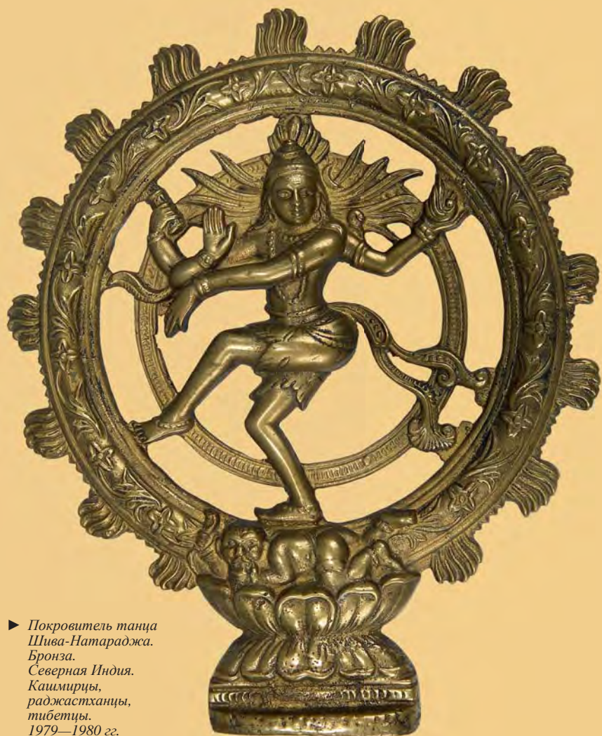
► Покровитель танца Шива-Натараджа. Бронза. Северная Индия. Каширцы, раджастханцы, тибетцы. 1979—1980 гг.

Самая яркая черта образа индуистского бога Шивы — сочетание контрастов. Часто он изображается в позе медитирующего йога, но от глубокого мистического созерцания может перейти к яростному неистовому танцу. Эта его ипостась называется Натараджа, «Владыка танца»; считается, что он изобрел 108 видов танца. Индусы верят, что Шива, устанавливающий ритм вселенной, в начале каждого космического цикла танцем пробуждает миры к жизни, а в конце уничтожает их. Его танец в центре круга из языков пламени выражает все качества этого божества как творца, хранителя и разрушителя вселенной, а положения его руки и ног исполнены глубокого смысла.