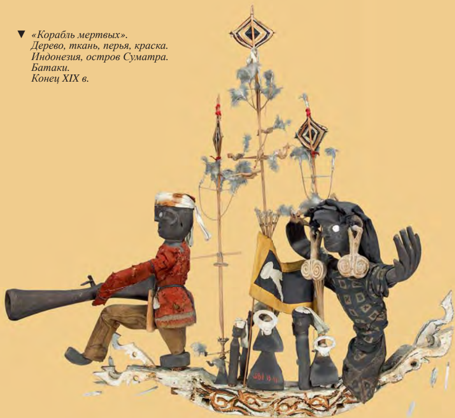
▼ «Корабль мертвых». Дерево, ткань, перья, краска. Индонезия, остров Суматра. Батаки. Конец XIX в.

«Корабли мертвых», представленные на экспозиции, поступили в Музей в конце XIX в.