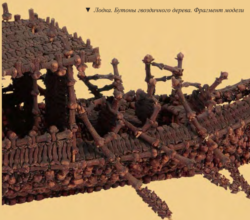
▼ Лодка. Бутоны гвоздичного дерева. Фрагмент модели

Народы, населяющие многочисленные острова Малайского архипелага, издавна славились как искусные мореплаватели. На своих судах, имеющих различные размеры, они выходили в море, занимаясь рыбной ловлей, поддерживали связь между островами, вели военные действия. Индонезийцы в течение веков вели оживленную морскую торговлю со странами Восточной, Южной и Юго-Западной Азии. Во время своих путешествий они доходили даже до побережья Африки.