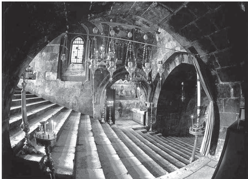
Рис. 3. Тоннель спуска к подземному храму Успения Богородицы в Гефсимании (Иерусалим, Палестина). Вид на погребальную крипту Иосифа Обручника

Дева-Богородица была положена хотя и неподалеку от захоронений своей родни (родителей — праведных Иоакима и Анны — и мужа — Иосифа Обручника), но в «новом гробе», как это передано апокрифом Протоевангелия — «Книгой Иакова» 1 . Именно это «особое помещение» и застал опустевшим ап. Дидим Иуда Фома, опоздавший на погребение Марии на три дня. Древнейшая версия Протоевангелия от Иакова содержится в папирусе Бодмера (находка в Египте, 1958 г.) и датируется временем от середины II века по Р.Х., а Ориген на рубеже II–III веков излагает по этому источнику свои сведения о Богородице 2 .