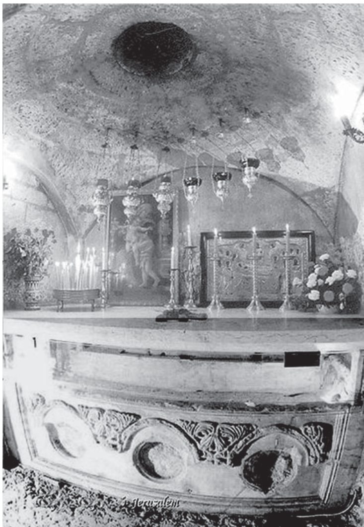
Рис. 4. Крипта Богородицы с погребальной «лавицей» Богородицы (прикрытой плитой трансенны), с «ереком» (круглым отверстием в куполе), свойственным раннеримской архитектуре

ния Богородицы в скальном останце размещается крипта, несколько углубленная в восточную стену скалы, с двумя входами, где Мария была погребена. Место ее погребения в очень небольшом помещении склепа (рис. 4) — такая же «лавица», как в Гробе Господнем, закрытая с наружной стороны боковой плитой трансенны, очень умеренно украшенная резьбой. В своде крипты — «ерек» (сквозное отверстие в куполе, свойственное раннеримской архитектуре).