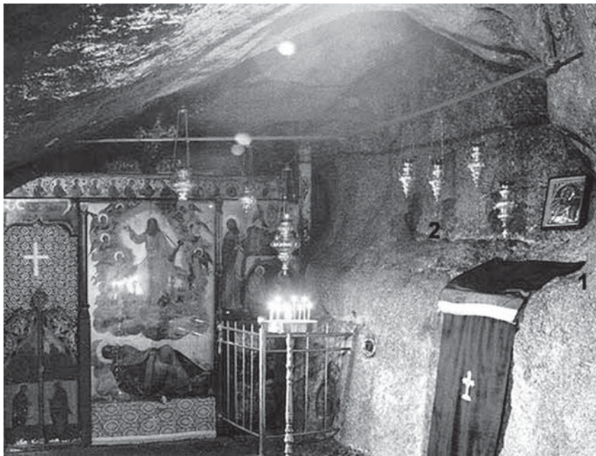
Рис. 2. «Пещера Апокалипсиса» на острове Патмос (Греция):

1. Престол, бывший «сидением» апостола; 2. Чашеобразное углубление «жертвенника». Фотография М.В. Соболевой, 2007 г.