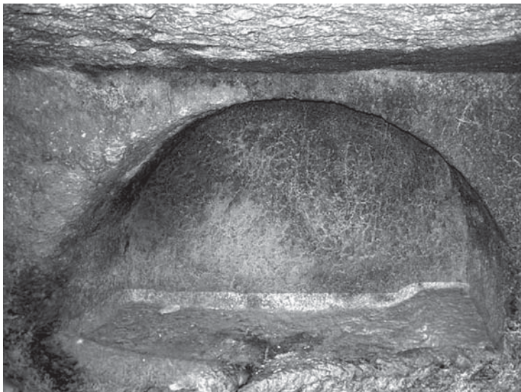
Рис. 6. Погребальная «лежанка» в нише-аркасолии в пещерном склепе на некрополе Корикос у города и крепости Киз-Килисе (пров. Мерсин) на Средиземноморском побережье Турции. Фотография Ю.А. Долотова, 2010 г.

Подобные углубления (для стока жидкостей мертвого тела?) изредка встречаются на поверхностях лежанок, как это устроено в одном из аркасолий (рис. 6) в некрополе римского времени на Малоазийском побережье (Турция) у Мерсии (Киз-Килисе), возле крепости Корикос, где некоторые погребальные стелы над склепами могут быть интерпретированы как христианские.