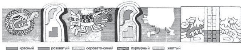
Рис. 97. Фрагмент полихромного фриза высотой 90 см в святилище на вершине главной платформы комплекса Гарагай близ Лимы, третья четверть II тыс. до н.э. [Fung Pineda 1988: 92], по [Agurto Calvo 1984: 74–75]. Весьма вероятно, что изображены первопредки, напоминающие качина у индейцев пуэбло, чьи костюмы и маски надевали участники ритуалов

формы комплекса Гарагай в районе Лимы (вторая половина II тыс. до н.э.), об этом свидетельствуют (рис. 97). Изображения того же характера мы видим на масках индейцев юри из северо-западной Амазонии, сделанных в начале XIX в. (рис. 98). Хотя частные стилистические особенности различаются, сам принцип создания фантастических образов путем комбинации различных антропо- и зооморфных элементов один и тот же.