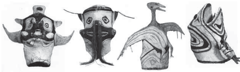
Рис. 98. Маски индейцев юри, северо-западная Амазония, начало XIX в., по [Brésil indien 2005: 53]

Добавим, что у индейцев Амазонии и бассейна Ориноко ритуалы, отмечающие посещение мира людей первопредками, нередко включают использование галлюциногенов. В древних обществах андского региона происходило, скорее всего, то же самое.