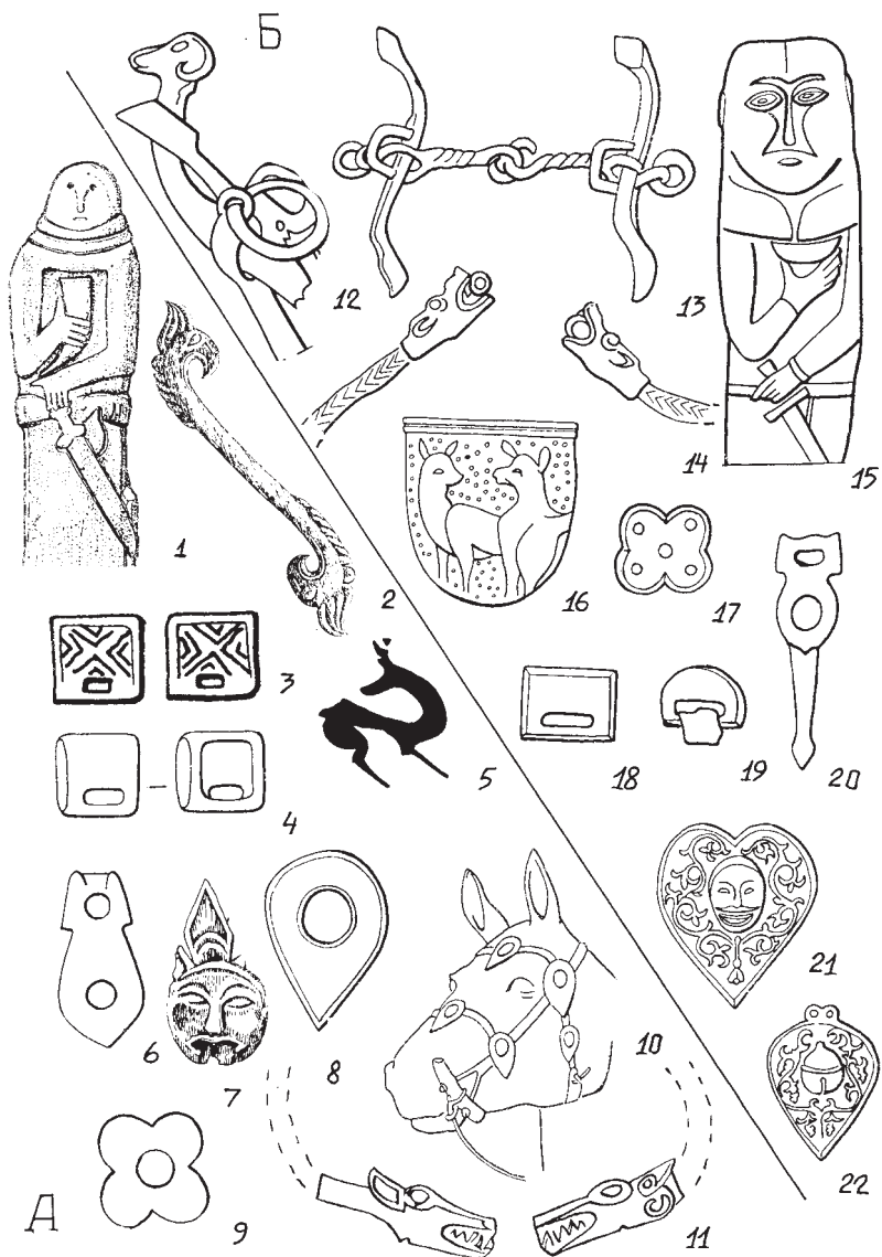
Рис. 1. Цикличность в материалах скифского (1–11) и древнетюркского времени (12–22). А — ИГС скифского времени, Б — ИГС древнетюркского времени