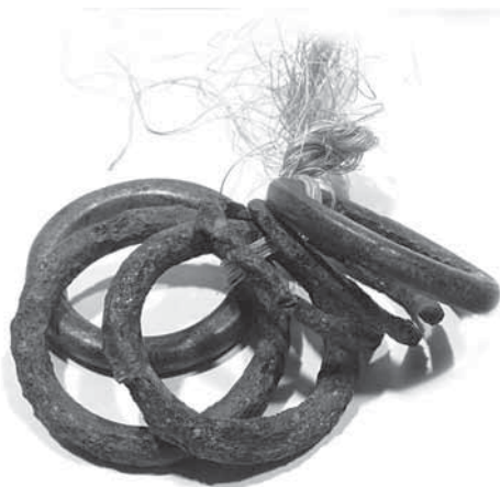
Рис. 4. Связка-приношение из колец (А-273-1). Священное место на реке Нумги

в этом направлении были предприняты в 60–70 годах прошлого века Борисом Фроловым. Он опубликовал целую серию работ, включая монографию «Числа в графике палеолита», где не только систематизировал огромный фактический материал, но и сделал блестящие комментарии [Фролов 1974].