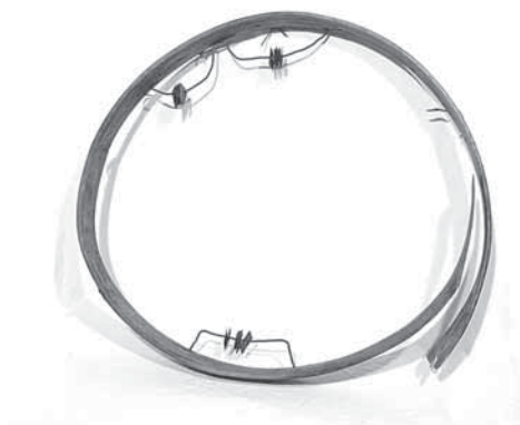
Рис. 2а. Обечайка шаманского бубна (А-332-1). Священное место на реке Нумги