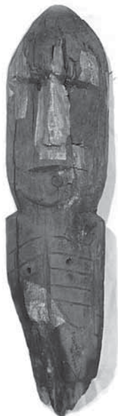
Рис. 3. Дух-хозяин святилища (А-247-1). Священное место на реке Нумги

многочисленные приношения ( приклады ) в виде различных металлических предметов. Среди них оказалась и связка из колец (рис. 4). В настоящее время в связке находится шесть колец: два бронзовых и четыре железных, причем два из них разъемные. Вероятно, седьмое — разъемное — кольцо было утрачено. Если вернуться к повествованию о Семи Чумах, то, очевидно, что в связках-приношениях должно было быть семь колец: только связки из семи колец принято приносить в дар духам.