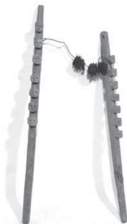
Рис. 2б. Рукоять (А-463-1) от шаманского бубна (А-332-1). Священное место на реке Нумги