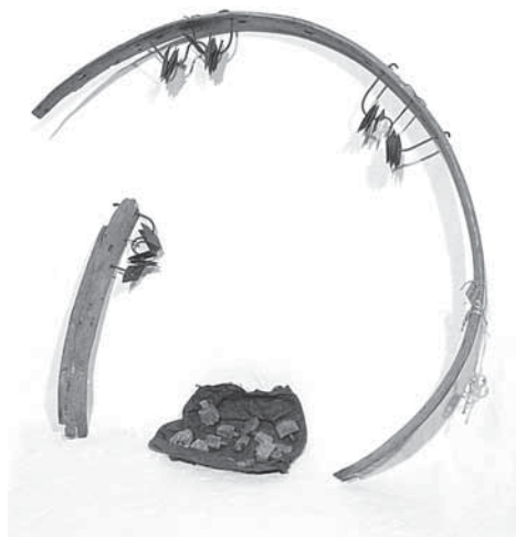
Рис. 1а. Обечайка шаманского бубна (А-331-1). Священное место на реке Нумги