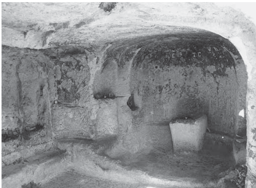
Рис. 2. Вид на алтарную часть храма «Донаторов», по Ю.М. Могаричеву

ющего к внутренней поверхности апсиды престола в храме Донаторов выполнена скамеечка-приступок, на которой вполне возможно сидеть (рис. 2). Видимо, это уже полноценный синтрон, хотя, судя по устроенному впритык к апсиде престолу, занимающему пространство Горнего места (такового здесь еще нет), храм строился до решений Трулльского собора 692 г.