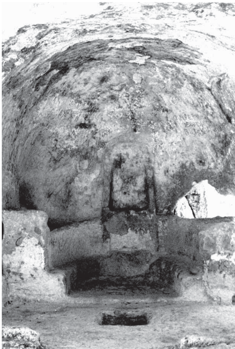
Рис. 3. Алтарная часть храма «Судилище» при въезде в древний город Эски-Кермен (Крым), по С.В. Харитонову (2004)