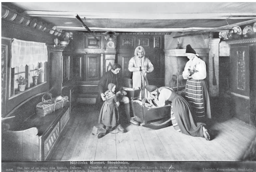
Рис. 3. Комната крестьянского дома в приходе Рэтвик-Далекарлия. Экспозиция Северного музея. МАЭ. Колл. № 1689-10