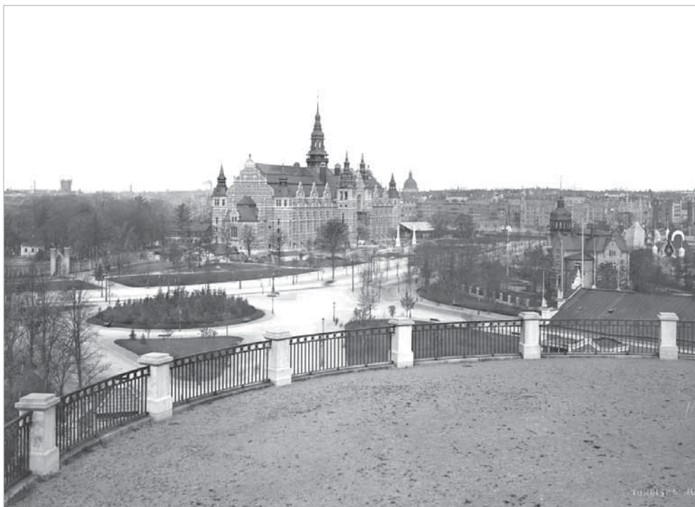
Рис. 4. Вид здания Северного музея и городских кварталов со стороны Скансена. МАЭ. Колл. № 1689-16