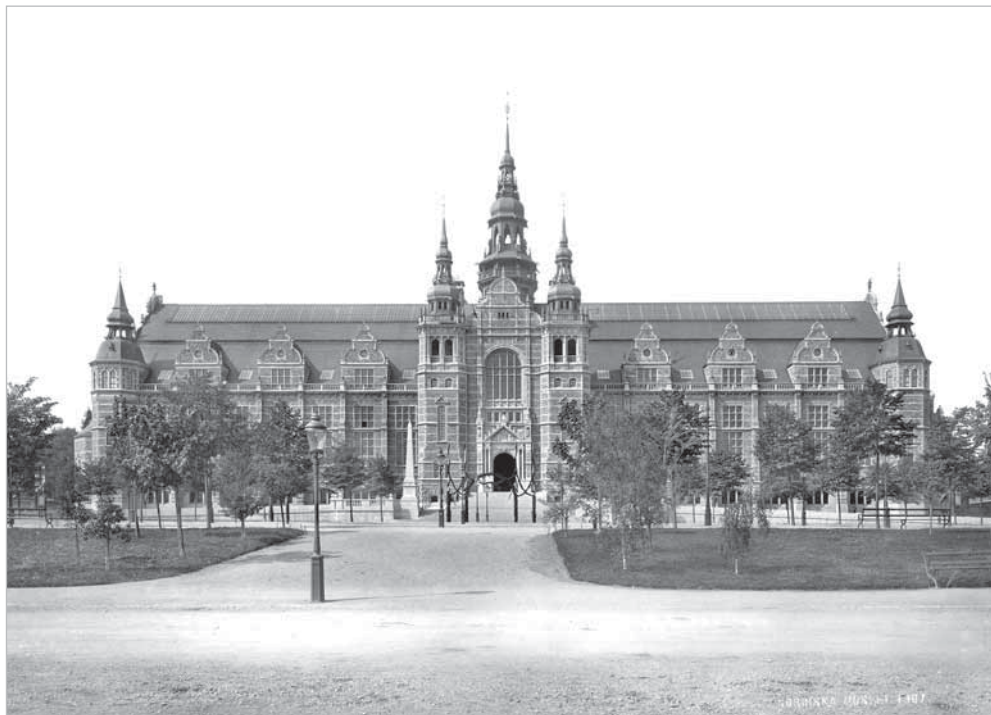
Рис. 5. Вид здания Северного музея в 1907 г. МАЭ. Колл. № 1689-15

На фотографиях коллекции № 1689-9, 10, 11, 12, 13, 14 [МАЭ: Описание колл. № 1689] представлены фрагменты экспозиции Северного музея, посвященные истории шведского национального костюма и традиционного уклада крестьянства.