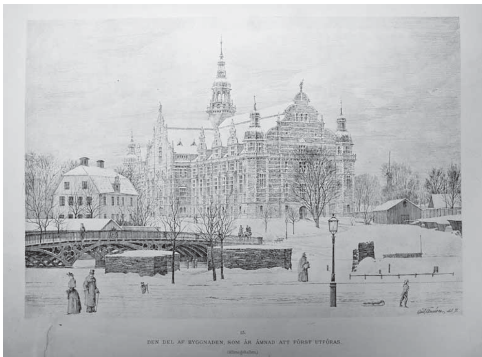
Рис. 2. Иллюстрация из альбома “Nordiska museet”. 1891. Рисунок Густава Класона. БМАЭ. Д-53, р. 15

Почти сразу после начала строительства А. Хазелиус понял, что традиционное размещение экспонатов за стеклами шкафов и витрин его не устраивает. Его просветительская концепция — дать посетителям возможность почувствовать себя частью исторической или географической среды, вжиться в нее — требовала иного «антуража» и иного устройства. В результате и родилась идея «Скансена» — необычного музея под открытым небом как продолжение Северного музея. В 1963 г. оба музея стали независимыми друг от друга.