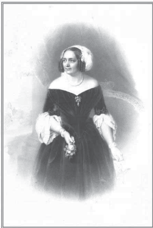
Рис. 5. Герцогиня Августа

и трогательных чувствах к российскому самодержцу, которые испытывал покойный герцог. Герцогиня Августа выразила свое глубокое уважение императору Николаю I, которое мог бы засвидетельствовать и покойный муж герцогини Хайнрих, «если бы он был жив» 20 .