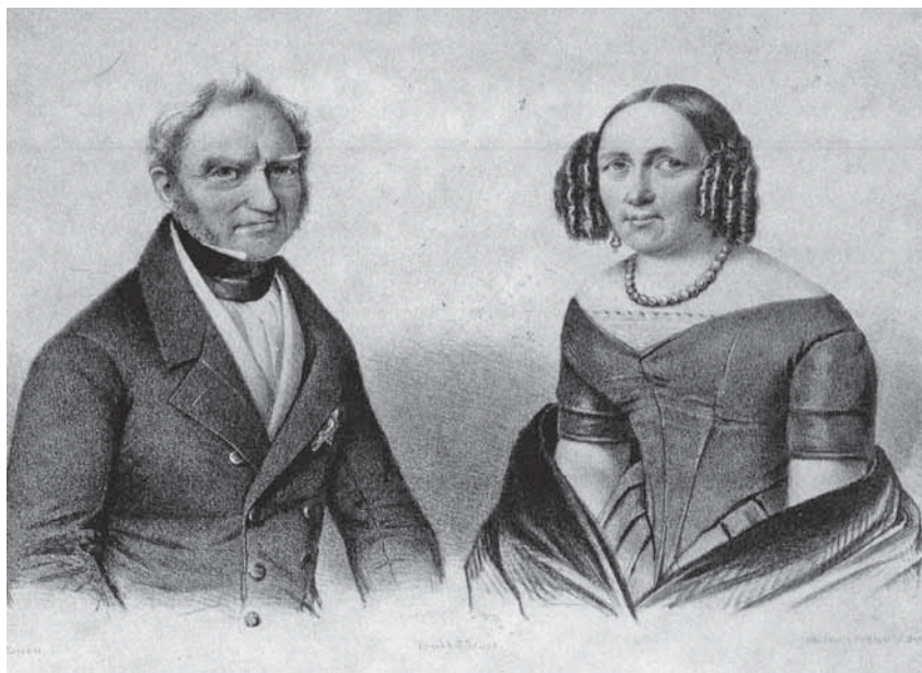
Рис. 4. Герцог Хайнрих с женою

23 ноября 1847 г. в Кетене скончался герцог Хайнрих. В тот же день в Санкт-Петербург вдовой покойного Августой (урожденная Августа Фредерика Эсперанска фон Ройс-Шляйц-Кестритц) было отправлено письмо (рис. 4, 5). В нем, между прочим, говорилось о том, что ее любимый супруг имел к императору Николаю I глубокую привязанность, которую сохранял до последнего вздоха, она писала о глубоких