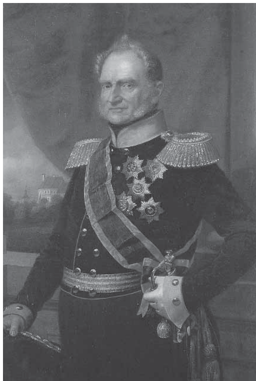
Рис. 1. Герцог Хайнрих