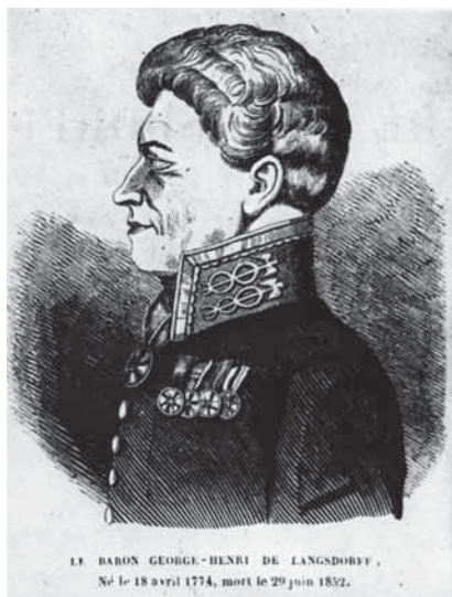
Рис. 4. Г.И. Лангсдорф в форме посла России в Бразилии. Портрет кисти неустановленного художника. Не ранее 1812 г., не позднее 1820 г. (СПФ АРАН. Р. X. Оп. 1-Л. Д. 189. Фотокопия. Опубл.: Комиссаров Б.Н. Григорий Иванович Лангсдорф. 1774–1852. Л., 1975)