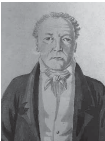
Рис. 2. Г.И. Лангсдорф. Портрет кисти Э. Флоранса. 1827 г. В 1965 г. хранился в Сан-Паулу и являлся собственностью госпожи Евангелины Флоранс, внучки художника (СПФ АРАН. Ф. 63. Оп. 1. Д. 49. Л. 1. Фотокопия)