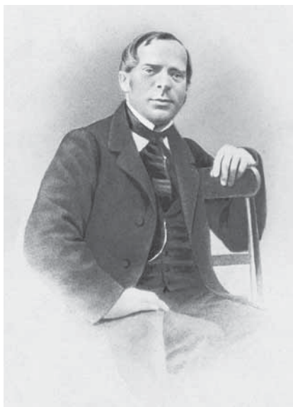
Рис. 2. Карл Францевич Альбрехт (РГИА. Ф. 678)