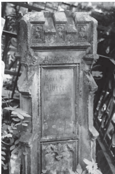
Рис. 6. Надгробие на могиле Карла Францевича Альбрехта в Гатчине

Отпевали Карла Францевича в католической церкви св. Екатерины и похоронили в Гатчине на лютеранском кладбище. По словам А. Римского-Корсакова, «он пользовался общею любовью как своих товарищей, так и учащегося юношества, которые, любя его, поставили ему над могилой прекрасный памятник». Памятник стоит и поныне, хотя несколько пострадал в годы Второй мировой войны, но надписи вполне читаются (рис. 6). В одной ограде с ним похоронены сын Евгений и дочь Франциска.