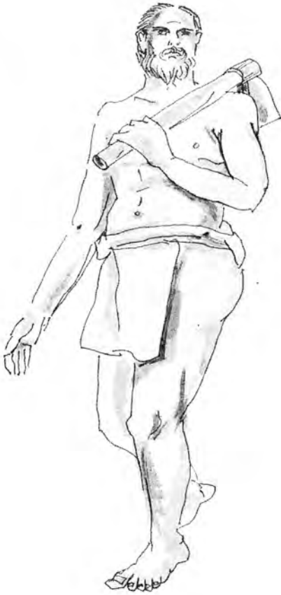
Рис. 2. Ведда с топориком. Рисунок Дамбана Гунавардана. [Dambane Gunawardana 2005: 62]

Кроме мяса, другим важным и любимым продуктом веддов, также издавна являвшимся единицей меновой торговли с сингалами и тамилами, был мед диких пчел. Его добывали, вырезая соты из дупла дерева или из скальной ниши с помощью топорика или наконечника стрелы, а также выбивая соты деревянным шестом с четырьмя зубцами на конце. Во время этой операции ведды неизбежно сталкивались с пчелами. Во избежание их укусов человека окуривали или смазывали маслом из специальных трав, отбивающих запах тела и тем самым дезориентирующим пчел. Кроме того, использовали заклинания, направленные на избегание пчел. Добыча меда, связанная со знаниями природы диких пчел и умением обезопасить себя от их ярости, была сугубо мужским занятием, владение которым вызывало уважение и возвышало ведда в глазах и сородичей, и соседей — сингалов и тамиллов.