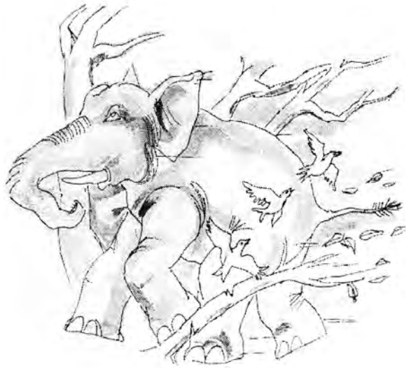
Рис. 4. Слон в джунглях. Рисунок Дамбанае Гунаварданы [Dambane Gunawardana 2005: 61]

как и у их соседей сингалов, некогда существовала загонная охота на слонов. В отличие от сингалов, согласно записям Р. Нокса (XVII в.), ведды охотились на это животное и в одиночку. Охоту на слона Р. Нокс описывал так: «Когда слон лежит спящим, они втыкают ему в подошву свой топор и, сделав его хромым, подчиняют его себе» [Нокс 2007: 66]. О мясе слонов как о любимом лакомстве веддов упоминал русский ученый-востоковед И.П. Минаев, побывавший в поселениях этого лесного народа во время своего путешествия по Цейлону (ныне Шри Ланка) в 1877–1878 г. [Минаев 1878: 170].