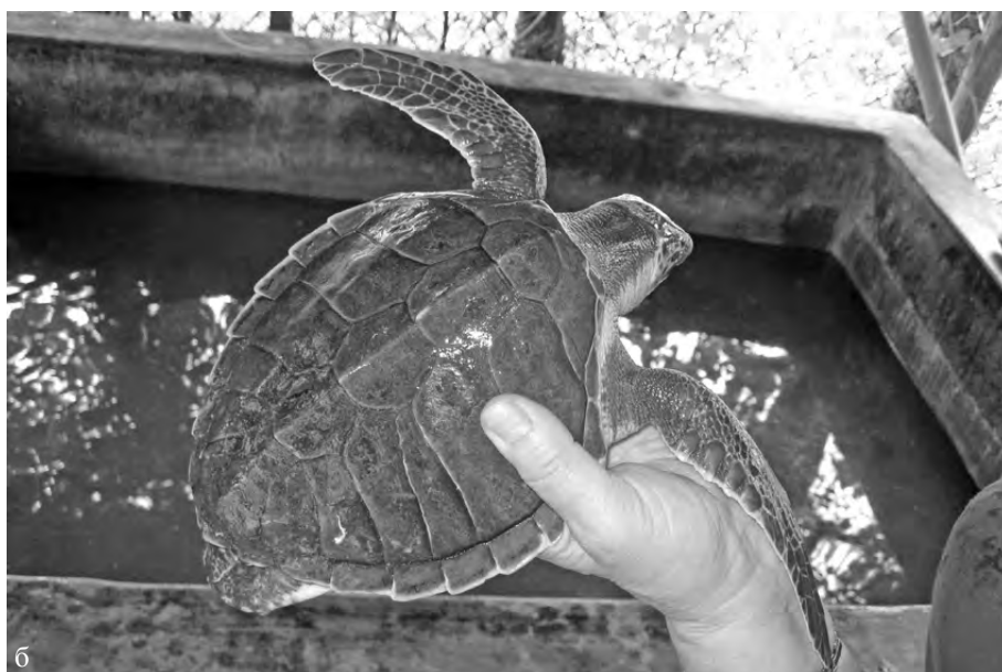
Рис. 3а, б. Косгода — черепахи, проходящие реабилитацию.