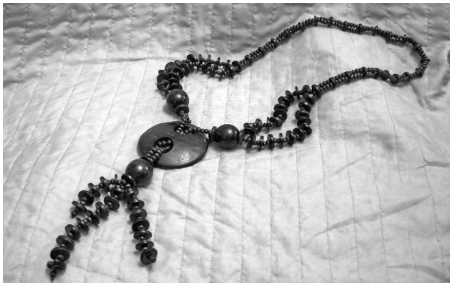
Рис. 9. Современное ожерелье из скорлупы кокосового ореха и деревянных бусин.

настырь. Белый цвет присущ и школьной форме (и у девочек, и у мальчиков). Он считается магически «чистым», а потому «охраняемым». Хотя исторически, кажется, синий и черный цвета действительно выступали в качестве траурных. Знаток традиционной материальной культуры сингалов А. Кумарасвами сообщал, что в прежние времена полоски синей ткани развешивались по случаю траурных моментов [Coomaraswamy 1908: 233]. В случае с нашим ожерельем, думается, символическая маркировка изделия из темной черепахи в какой-то степени связана с европейскими понятиями. И, кстати будет сказать, в упомянутом труде А. Кумарасвами, который имеет энциклопедический характер и специально посвящен истории художественных ремесел у сингалов, нет даже упоминания об изделиях из черепахового панциря, тогда как есть раздел об изделиях из перламутровых раковин.