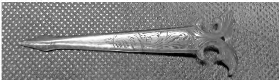
Рис. 7. Шпилька для волос. МАЭ РАН. Колл. №3095-3

Собиратели сообщают, что такого рода ожерелья на Цейлоне надевают женщины, носящие траур. Причем первые три месяца после печального события женщины не носят никаких украшений, затем спустя шесть месяцев или год, выходя из дома, они надевают украшения из темного панциря черепахи.