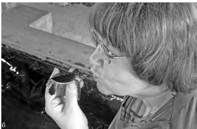
Рис. 2а, б. Черепаший молодняк.