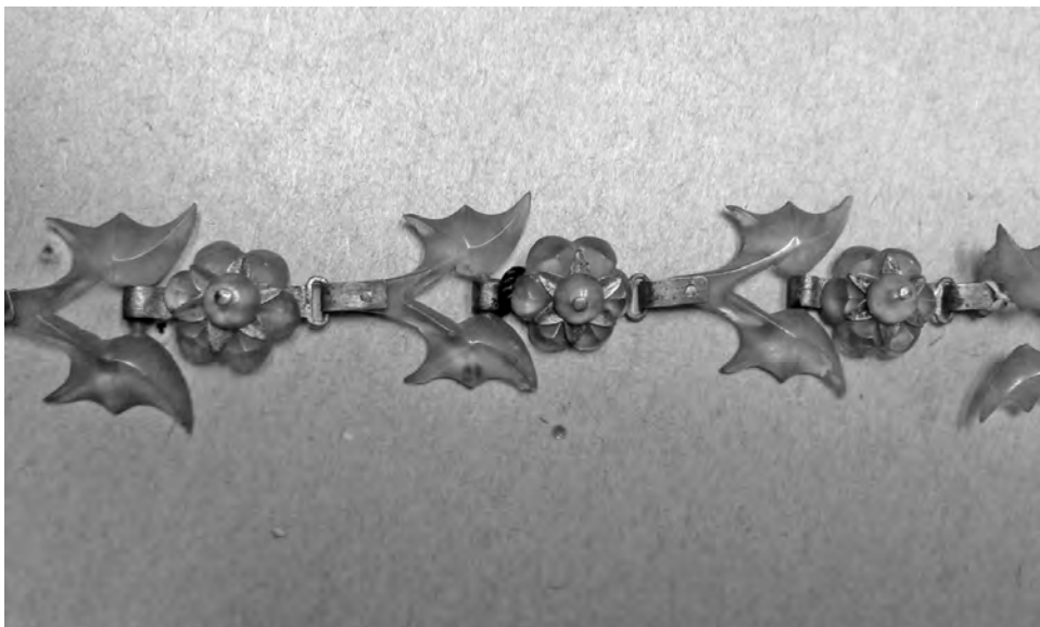
Рис. 5. Ожерелье из деталей панциря. МАЭ РАН. Колл. № 3095-1

Тонкие резные листики соединены мастером в изящный цветок, а цветы соединены небольшими металлическими деталями. Собиратели сообщают, что подобные ожерелья очень ценили на Цейлоне, по своей ценности они соотносились с золотыми украшениями. Такие ожерелья могли носить состоятельные женщины высоких каст.