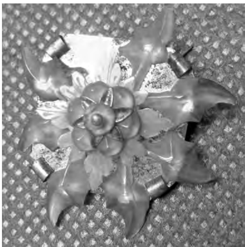
Рис. 6. Брошка. МАЭ РАН. Колл. № 3095-2

Прекрасный пример изделий из единого панцирного щита — шпилька