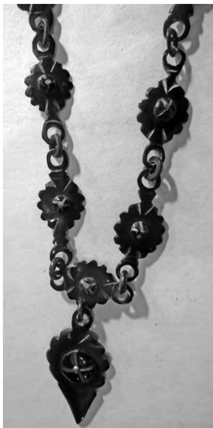
Рис. 8. Ожерелье. МАЭ РАН. Колл. №3095-6

В настоящее время трудно выделить, какой цвет является специально траурным. На похороны, например, ходят в белых одеждах, как и на ритуалы в мо-