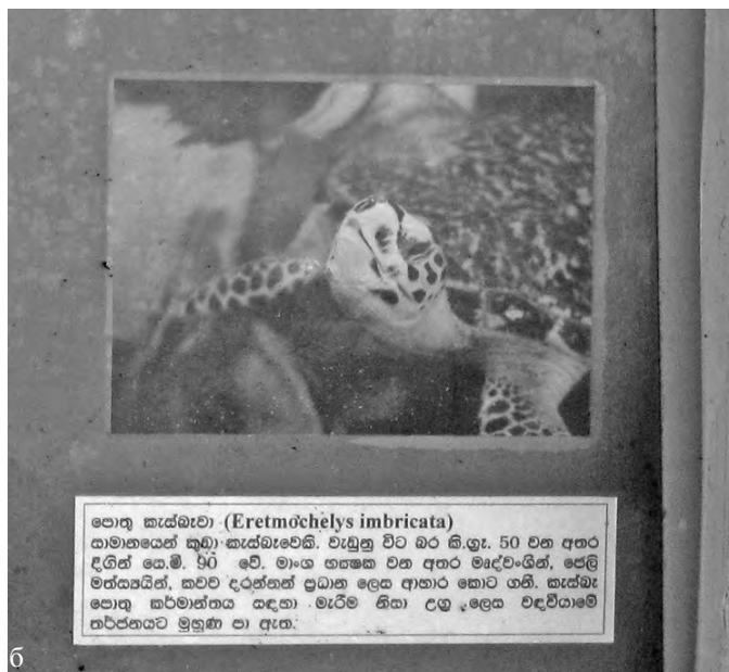
Рис. 4а, б. Косгода — плакаты на английском и сингальском языках.