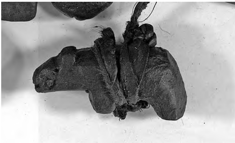
Рис. 4. Фигурка медведя — фрагмент связки А-356-I

Все предметы связки обмазаны органическим веществом до образования на их поверхности значительной корки черного цвета.