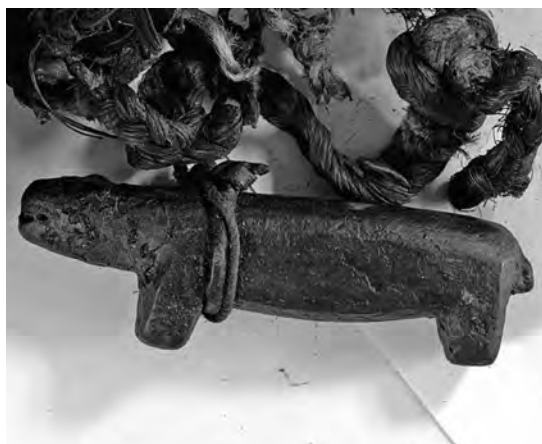
Рис. 7. Фигурка медведя — фрагмент связки А-357-1