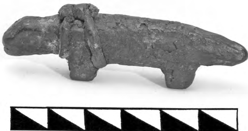
Рис. 9. Фигурка собаки — фрагмент связки. Поселок Лорино. Инв. номер ГМИР А-387-1

(к одному из медвежьих черепов была прикреплена крупная красная бусина), 2 ворона целиком (высохшие трупы), только у одного были оторваны ноги, 3 головы, связанных с когтями полярной совы, несколько <штук — зачеркнуто > голов ворона. Черепа и трупы я не имел возможности везти в виду их громоздкости, и они были уничтожены» [Лавров 1941: 13–14].