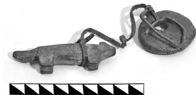
Рис. 8. Фрагмент связки. Поселок Аккани. Инв. номер ГМИР А-386-І

Связка включает деревянную фигурку животного и камень, связанные ремешком. Фигурка животного, возможно, собаки, выполнена тщательно, но обобщенно. Небольшая голова с короткой сужающейся мордой, уши переданы рельефом, глаза и рот не изображены. Спина прямая, переходящая в слегка изогнутый толстый хвост. Конечности в виде четырехугольных выступов сведены, но разделены врезами. Размеры фигурки — длина 7,5 см, ширина 1,2 см, высота 2 см. Сразу за передними конечностями привязан тонкий ремешок (длиной 12–13 см), к другому концу которого прикреплена округлая плоская галька с естественным отверстием (размеры 4,8×4,2×0,9 см).