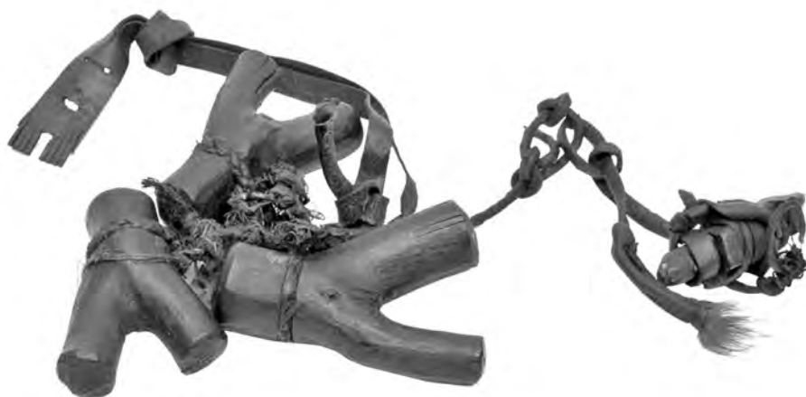
Рис. 2. Связка с антропоморфными изображениями и собакой. Поселок Аккани. Инв. номер ГМИР А-355-1

Все предметы связки, кроме ремня с антропоморфной фигурой на конце, имеют на поверхности следы черного органического вещества.