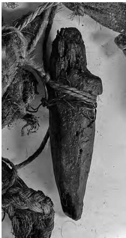
Рис. 6. Фигурка ластоногого — фрагмент связки А-357-1