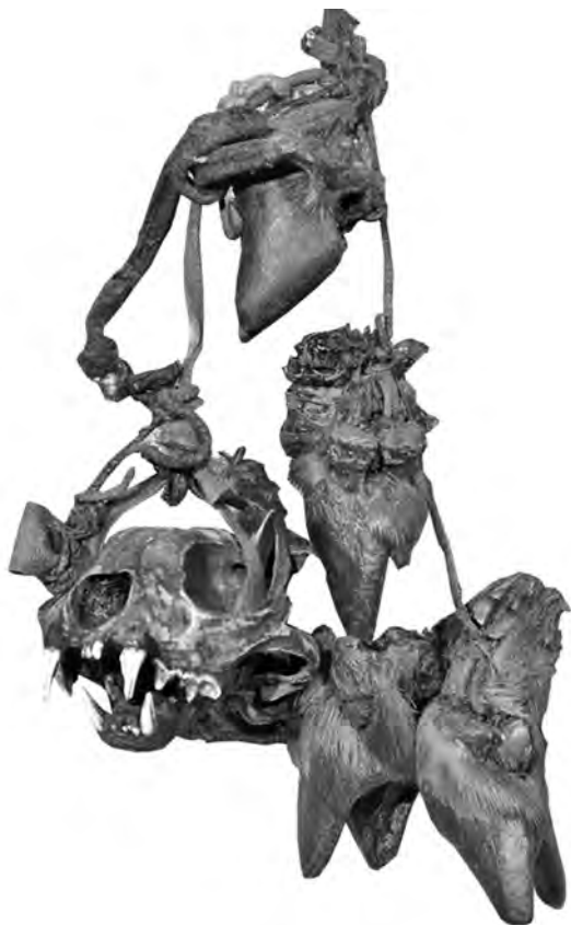
Рис. 1. Связка с черепом рыси и копытами снежного барана. Поселок Аккани. Инв. номер ГМИР А-354-1

мех рыжего цвета. По определению М.В. Саблина, это копытца от одной особи. Они соединены попарно жильной нитью, пропущенной между верхними частями фалангам, причем одну пару составляют передние, а вторую — задние. Размеры: первая пара — 10,5 и 11 см, вторая пара — 10,5 и 8 см.