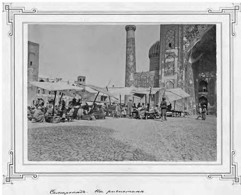
Рис. 2. Лютче Я. Я. «Самарканд. На регистане». Конец XIX в. МАЭ, колл. № 512-177

Известный востоковед академик барон В. Р. Розен в 1899 г. передал музею обширное собрание фотографий дипломата и коллекционера Я. Лютче по населению Ферганской области и Самарканду (рис. 2) 40 .