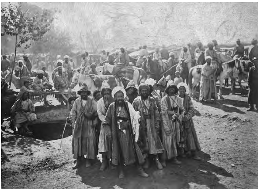
Рис. 3. Н. Н. Щербина-Крамаренко. «Дервиши. Сарты. Самарканд». Конец XIX — начало XX в. МАЭ, колл. № 1487-15

по отношению к оседлому таджико-узбекскому населению, — «оседлое население Западного Туркестана»». Дополнял коллекцию текст, написанный арабским шрифтом.