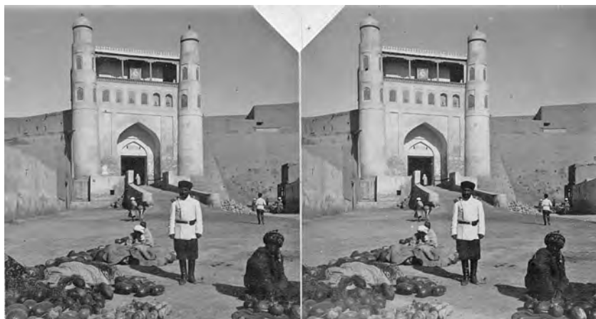
Рис. 4. «Арк. Бухара». Начало XX в.

Одним из аспектов деятельности экспедиции Н. И. Веселовского было изучение, научная фиксация, охрана и создание научного проекта реставрации историко-архитектурных сооружений Самарканда. Первыми объектами изучения стали Гур-эмир и Биби-ханым. Работа предстояла очень большая и была рассчитана на несколько лет.