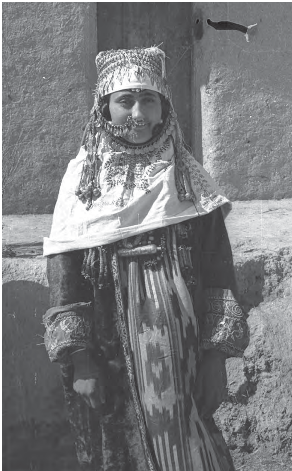
Рис. 7. Молодуха в свадебной и праздничной национальной одежде. К.Л. Задыхина. 1960 г. МАЭ. Колл. № И-1918-79