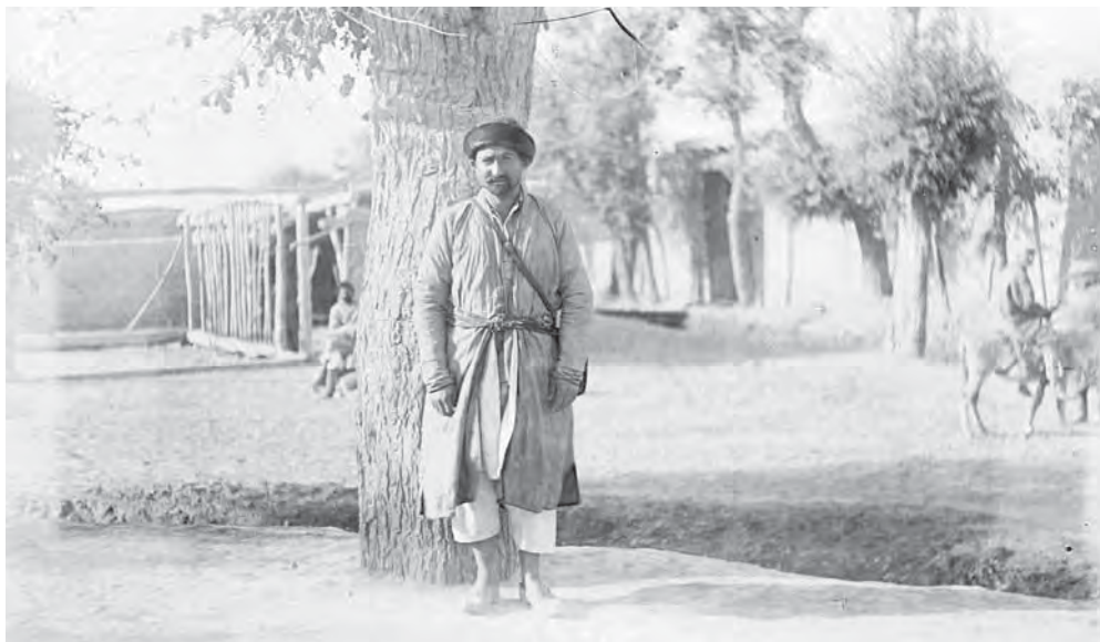
Рис. 5. Араб в обычной одежде. И.Н. Винников. 1936 г. МАЭ. Колл. № И-1071-1

Следующая коллекция с изображениями арабов Средней Азии поступила в музей в 1939 г. от И.Н. Винникова и была зарегистрирована Э.Г. Гафферберг под номером И-1071. Коллекция представляет собой два стеклянных негатива размером 9×12 см и два отпечатка с них. На первом отпечатке запечатлен мужчина в традиционной одежде (рис. 5), на втором — женщина в традиционной одежде, сидящая на земле и кормящая грудью ребенка (рис. 6).