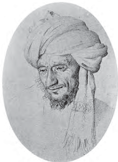
Рис. 3. Тип араба. Альбом «Туркестан. Этюды с натуры В.В. Верещагина», 1874 г. МАЭ. Колл. № И-674-143