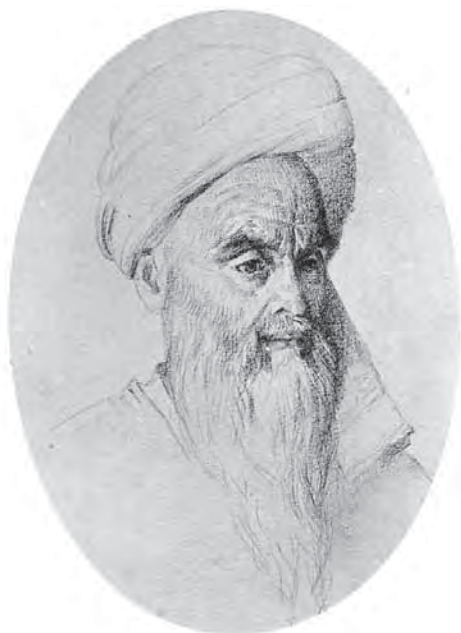
Рис. 2. Тип араба. Альбом «Туркестан. Этюды с натуры В.В. Верещагина», 1874 г. МАЭ. Колл. № И-674-142

В двух случаях мы видим два разных способа накручивания чалм. В третьем случае мужчина изображен в тибетейке. Все три головных убора нарисованы с фотографической точностью (рис. 2, 3, 4).