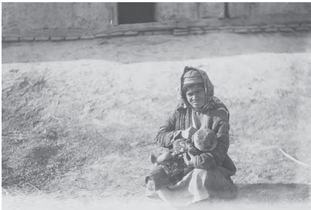
Рис. 6. Женщина, кормящая грудью ребенка. И.Н. Винников. 1936 г. МАЭ. Колл. № И-1071-2