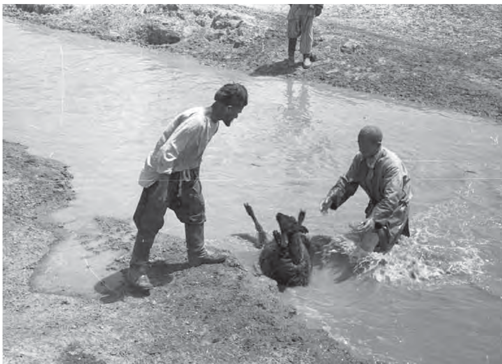
Рис. 8. Мойка овцы в арыке. К.Л. Задыхина. 1960 г. МАЭ. Колл. № И-1918-96