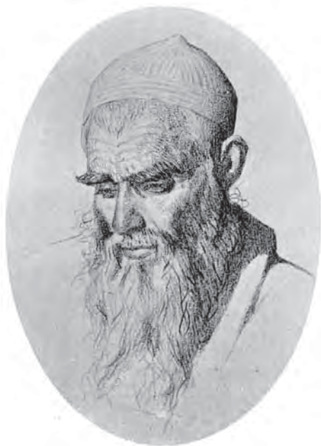
Рис. 4. Тип араба. Альбом «Туркестан. Этюды с натуры В.В. Верещагина», 1874 г. МАЭ. Колл. № И-674-144