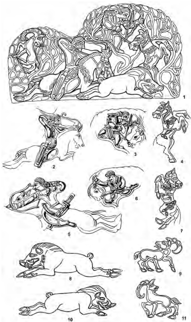
Рис. 1. Прорисовки изображений на поясных пластинах с сюжетом охоты на кабана из Сибирской коллекции Петра I: 1 — общий вид одной из пластин; 2–11 — отдельные образы на двух пряжках: 2, 5 — всадник на коне; 3, 6 — охотник на ветке дерева; 4, 7 — конь; 8, 10 — кабан; 9, 11 — козел (8 и 11 — зрелые, а 9 и 10 — молодые особи).

По материалам публикаций и рисункам М.П. Завитухиной (2–11), М.П. Грязнова (9, 11) и Л.С. Марсадолова (1)