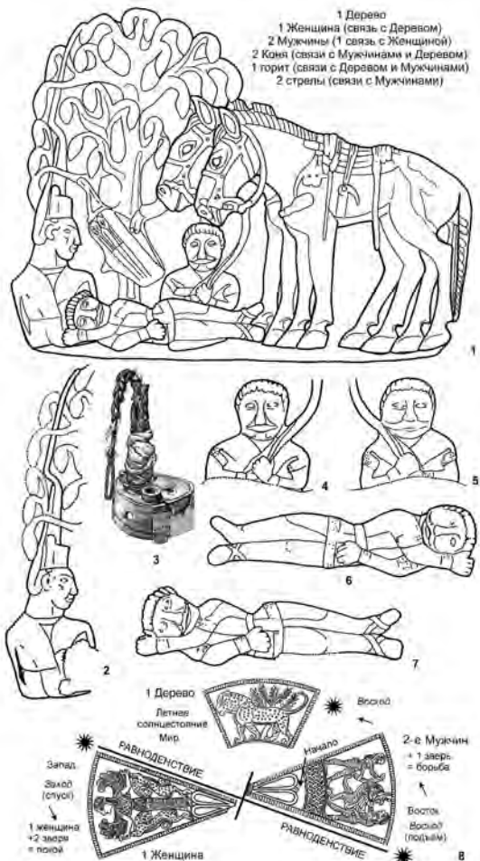
Рис. 3. Прорисовки изображений на поясных пластинах с сюжетом «Всадники под деревом» из Сибирской коллекции Петра I: 1 — общий вид одной из пластин; 2–7 — отдельные образы на двух пряжках: 2 — образ женщины/богини; 3 — головной убор женщины из кургана Пазырык-5; 4–5 — мужчина, сидящий под деревом (разные образы на двух пластинах); 6–7 — лежащий мужчина (зеркальные образы на двух пластинах); 8 — изображения на обкладках разных секторов зеркала из Келермеса и их привязка к астрономическим направлениям (на этом рисунке ориентация секторов сдвинута). По материалам публикации М.П. Грязнова (2–7) и прорисовкам Л.С. Марсадолова (1, 8)