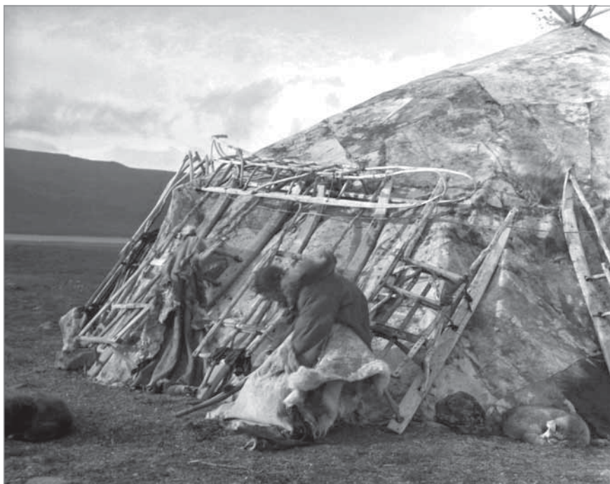
Рис. 62. Девушка Омрывакатгавыт занята выделкой шкур. Она работает на улице за ярангой. МАЭ РАН. И 1454-207