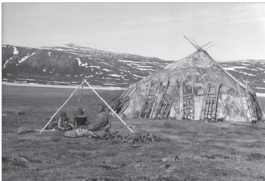
Рис. 71. Костер на улице вблизи яранги; на треноге подвешен котел с варящимися опаленными копытами. Туши заколотых телят, болевших «копыткой» (некробациллёзом). На заднем фоне видна яранга летнего периода с приставленными к ней грузовыми нартами, придающими жилью устойчивость в случае ветреной погоды. МАЭ РАН. И 1454-303