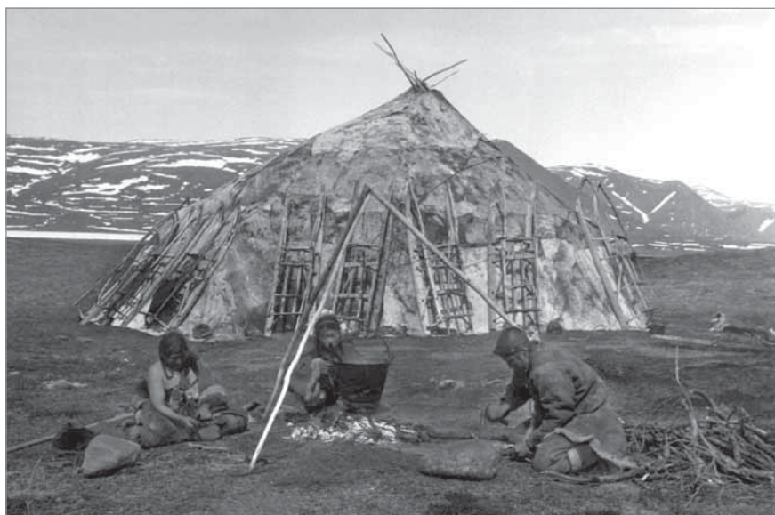
Рис. 67. Две кочевницы – Эттыкутгэвыт и Омрывакатгавыт, опаливают на костре, разожженном на улице у яранги, копыта телят. Телята заболели «копыткой» (некробациллёзом) и были заколоты. У Тымнэлькота, занятого кузнечной работой, на головном кожаном ремешке пришиты бисерные подвески – серьги, спускающиеся до плеча. МАЭ РАН. И 1454-299