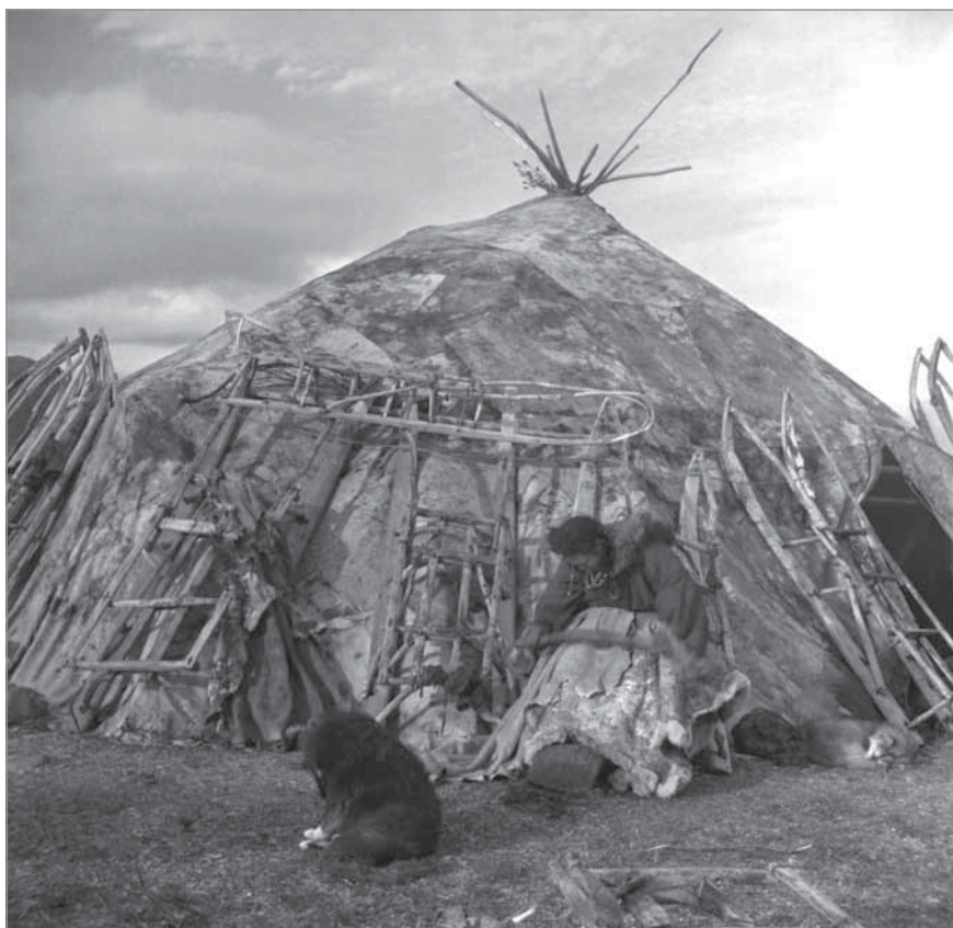
Рис. 63. Девушка размягчает каменным скребком мездру обрабатываемой оленьей шкуры.