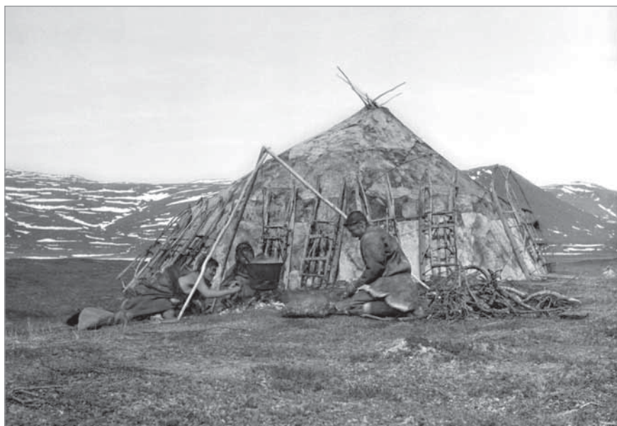
Рис. 68. Группа работающих у костра людей на фоне чукотской кочевой яранги. МАЭ РАН. И 1454-300