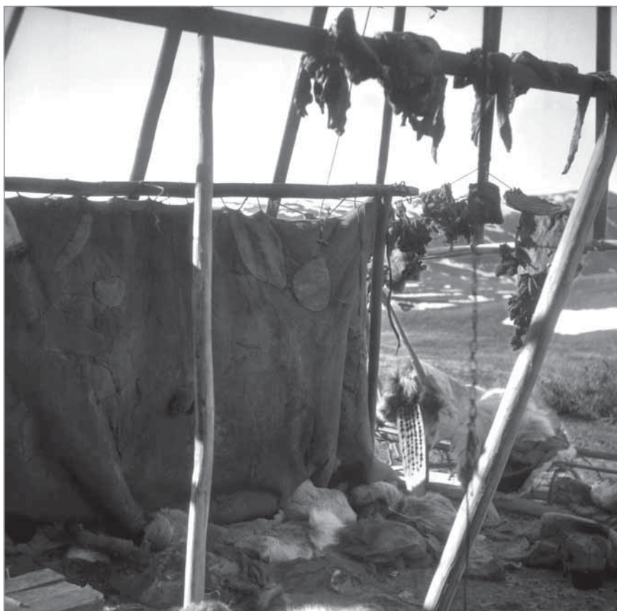
Рис. 55. Северный «святой» угол в яранге (от входа в ярангу с правой стороны) вблизи полога, где хранятся священные предметы. На земле впритык к карте поставлен деревянный прибор для выжигания огня (милгымил); на поперечной жерди остова жилища повешены деревянные амулеты (тайныквыт). На веревке и на жерди, помещенной над пологом, развешено оленьё мясо. Яранга Кэркугэ, 1950 г., озеро Экитыки. МАЭ РАН. И 1454-151.