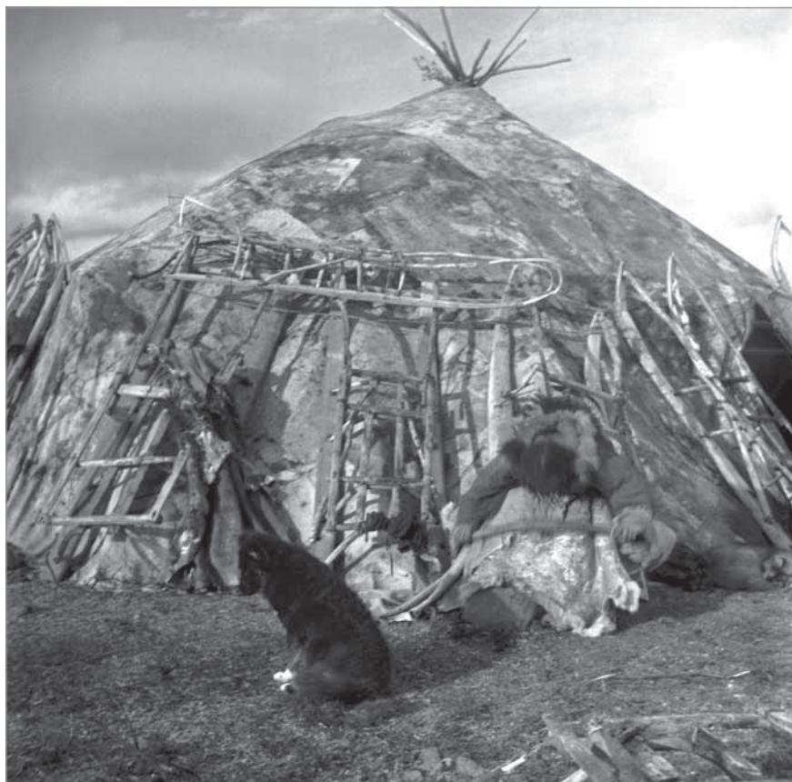
Рис. 64. Для проветривания мездры обрабатываемую оленью шкуру Омривакатгавыт раскинула на стоймя приставленные к яранге грузовые нарты. Омривакатгавыт одета в один нижний меховой комбинезон (кэркэр), обувь ее – камусные торбаза, окрашенные в темно-красный цвет глиной, носящие название по красителю – челгыегыт.