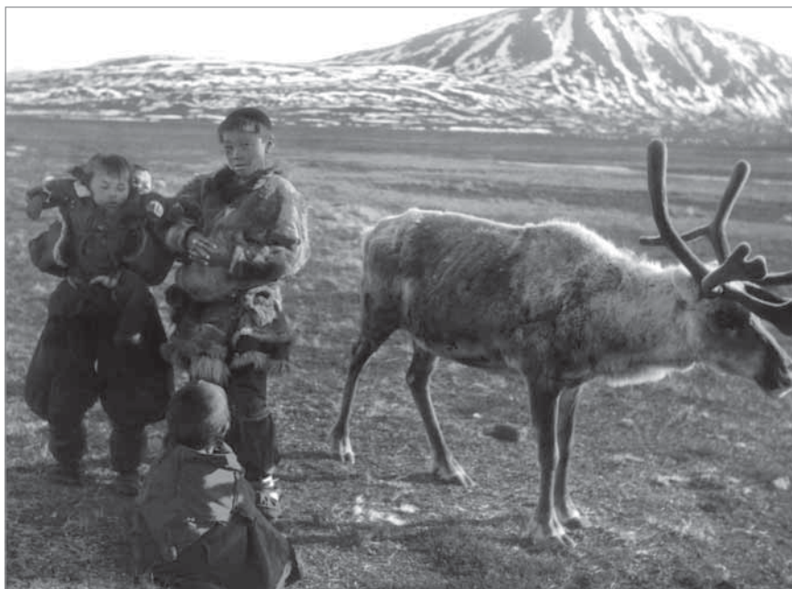
Рис. 50. Подросток-пастух Кымытэгын; девочка Тнаринтынэут держит на руках своего братишку Гатле, на земле сидит другой ее брат Гэматынагыргын. Озеро Экитыки, весна 1950 г. МАЭ РАН. И 1454-144