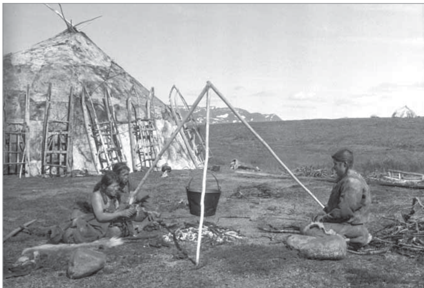
Рис. 70. Тымнэлкот за перековкой ножа; женщины варят в котле опаленные олени копыта и опаленные срезы с оленьих шкур. 1950 г., озеро Экитыки, Амгумская тундра, стойбище Тымнэнэнтына. МАЭ РАН. И 1454-302