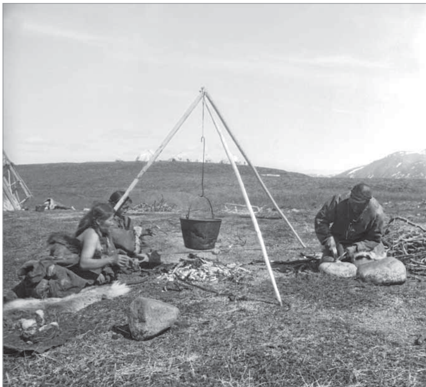
Рис. 69. Чукча Тымнэлкот использовал разожженный на улице между ярангами костер (на котором женщины опаливают оленьи ноги, а затем варят их в котле, подвешенном на треноге) для перековки нового ножа, приспособив для этой цели железную пластину от капкана.