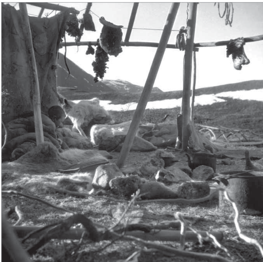
Рис. 57. Очаг в яранге, обложенный по кругу камнями. Вблизи полога на веревке вялятся оленье мясо. Сухое оленье мясо (кыкватъол) служит питанием в качестве легкого завтрака. На поперечной жерди остова жилища вблизи полога висят амулеты (тайныквыт).