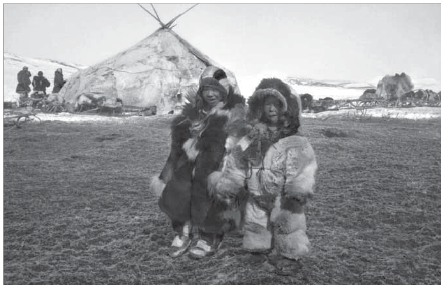
Рис. 52. Мальчик и Етгэвыт. На мальчике надеты бусы и браслет. МАЭ РАН. И 1454-181