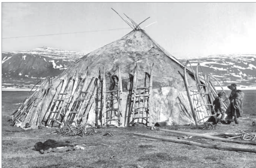
Рис. 45. Яранга Тымнэнэтына с приставленными к ней грузовыми нартами. Озеро Экитыки, 1950 г. МАЭ РАН. И 1454-16