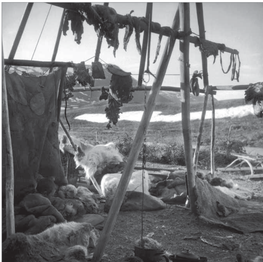
Рис. 56. Угол в яранге с северной «святой» стороны. Внешняя часть мехового полога, часть очага, около которого стоит кастрюля и чайник. Над очагом спускается железная цепь (гударачын) для подвешивания котлов и чайников. На земле вблизи нарты стоят деревянные доски для вытирания огня (милгыт). На поперечной жерди висят амулеты (тайныквыт). Развешено оленье мясо и кишки (элегйи). В углу на поперечной жерди висит начиненная жиром и мясом оленья колбаса (рорат). Яранга Пэнэ-нэут, озеро Экитыки, весна 1950 г.