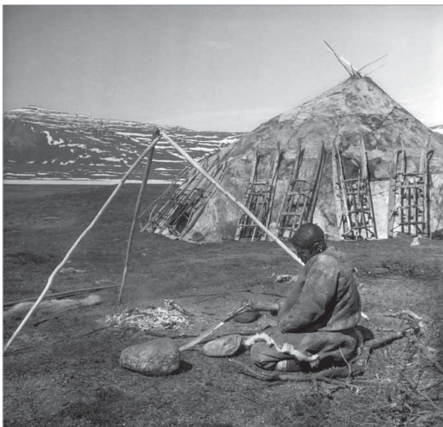
Рис. 66. Перековка ножа из куска железа. МАЭ РАН. И 1454-298