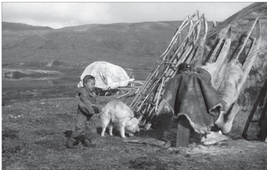
Рис. 61. Чукчанка Етгэвыт обрабатывает оленью шкуру, устроившись на улице около яранги. Набросив шкуру на деревянную доску (виур), женщина счищает мездру при помощи скребка. На земле лежат два скребка, вправленные в деревянные ручки. МАЭ РАН. И 1454-203