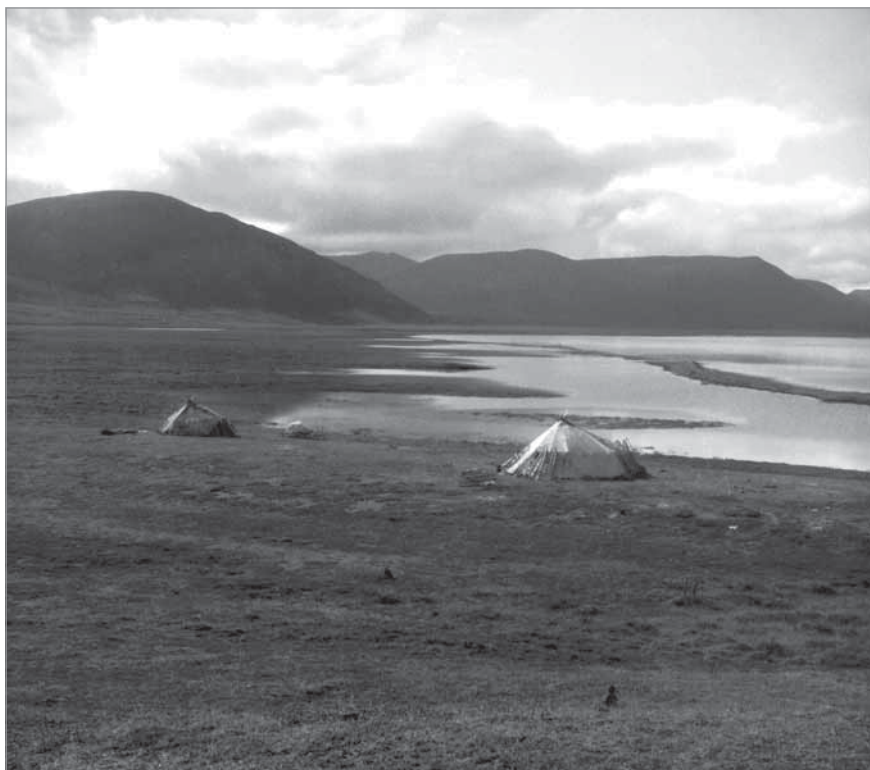
Рис. 46. Две яранги кочевых чукчей Тнарэнтыгыргына и Кэргугэ. 1950 г., озеро Эки-тыки. МАЭ РАН. И 1454-171

Она старалась делать серии фотографий, показывающих устройство яранги, процесс обработки шкур и т.д. Очень ценны пространственные и весьма подробные тексты описи негативов. Дневниковые записи, фотографии, опись иллюстративной коллекции с подробными и живыми описаниями снятых сюжетов, дополняя друг друга, дают великолепную возможность наполнить жизнью неподвижные и молчаливые изображения (рис. 53, 54, 55, 56, 57, 58, 59, 60, 61, 62, 63, 64).