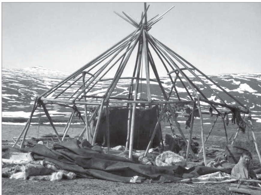
Рис. 53. Яранга без покрывки. Видны три пятника (вулвут), распирающие верхние части остова, придающие жилью большую прочность во время ветров. Полог висит на обычном месте у задней стены яранги. Около яранги на земле лежит снятая с нее покрывка. Справа сидит девушка из этой яранги Кэунэкай. Яранга Кэргугэ, озеро Экитыки, весна 1950 г. МАЭ РАН. И 1454-138