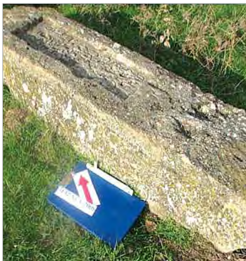
Рис. 2. Марага. Надгробие 1600 г.