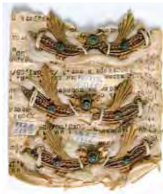
Рис. 2. Комплект застежек. Кумыки // ДМИИ им. П.С. Гамзатовой (Махачкала). КП-7376, С-5135