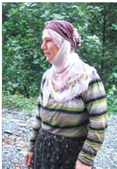
Хемшинка (провинция Артвин, Турция)