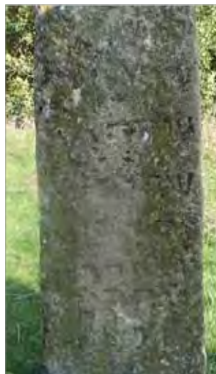
Рис. 3. Марага. Надгробие 1540 г.