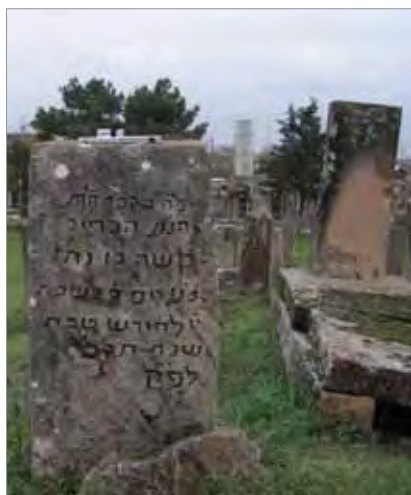
Рис. 4. Дербент. Еврейское кладбище. Ранний участок, общий вид