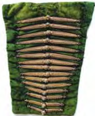
Рис. 1. Нагрудник. Кумыки // ДМИИ им. П.С. Гамзатовой (Махачкала). КП 4891-4905, С-1673-1687