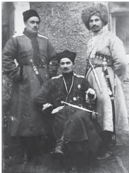
Рис. 2. Ингуши — офицеры Ингушского конного полка Кавказской Туземной конной дивизии.