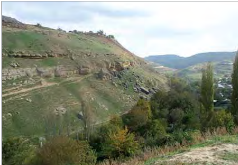
Рис. 1. Общий вид селения Марага