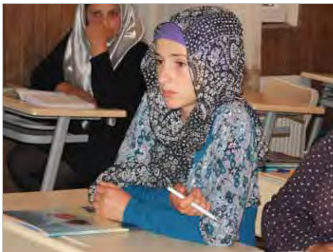
Ученица исламского пансиона в с. Деканашвили (Аджария, Грузия)

Фотографии были выполнены в рамках проекта «Разная земля»