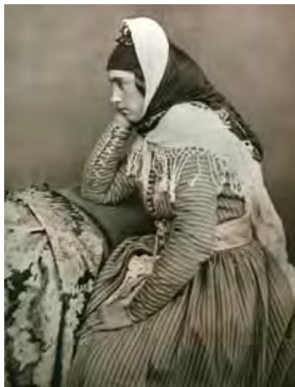
Рис. 5. Молодая карачаевка. Конец XIX в. // Женщины Кавказа. М., 2008