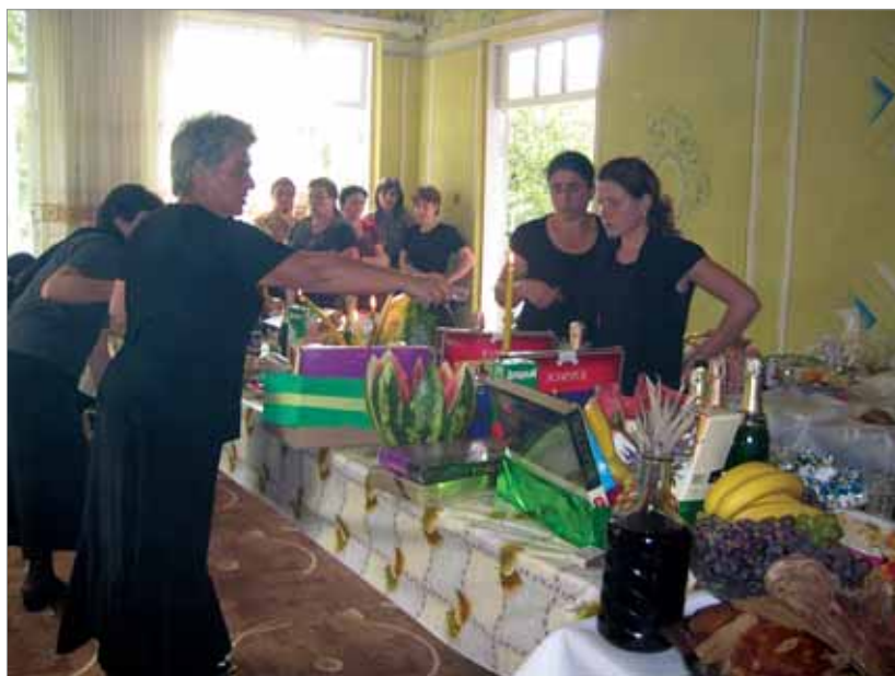
Рис. 2. Старшие сестры зажигают поминальную свечу