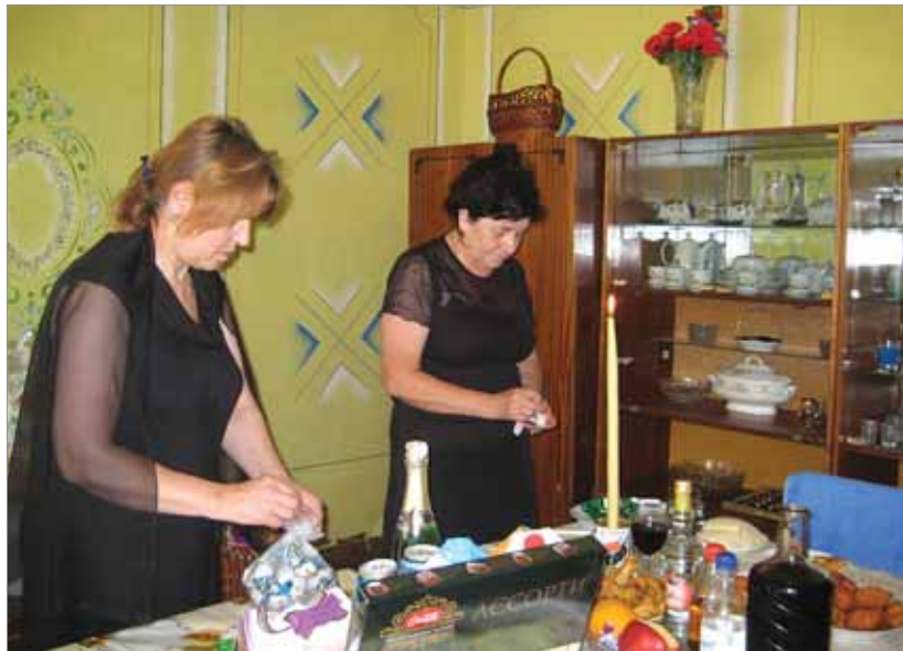
Рис. 3. Подготовка поминального стола