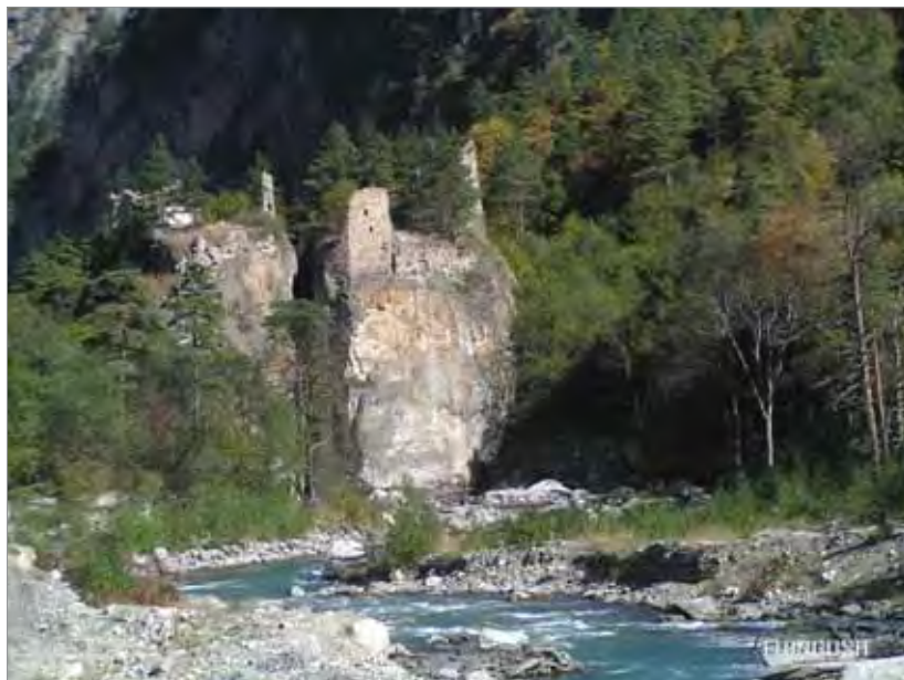
Рис. 2. Замок-крепость Гагиево. Ассинская котловина. Горная Ингушетия