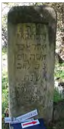
Рис. 10. Хели-Пенджик. Еврейское кладбище, надгробие с экраном