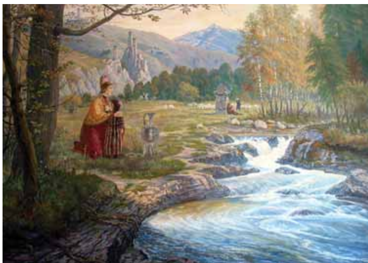
Рис. 2. Д.О. Оздоев. Старинная мелодия. Холст, масло. 1999 г. Фото О.Д. Оздоева, 2010 г.