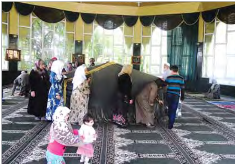
Внутри зиярата Кунта-Хаджи в с. Хьяьжи-Эвла