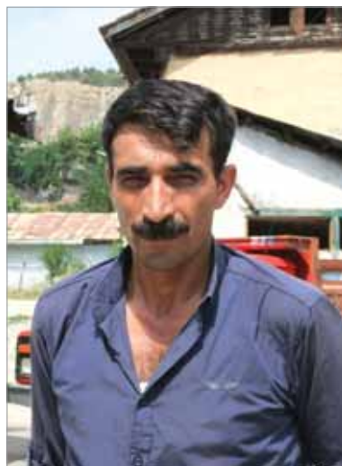
Курд-мыртыв/карачадырлы (г. Ардануч, провинция Артвин, Турция)