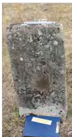
Рис. 12. Джерах. Еврейское кладбище, надгробие с антропоморфным экраном