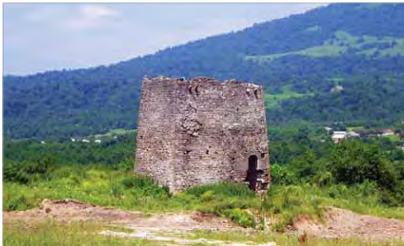
Рис. 1. Башни Гагиево. С. Алкун. Горная Ингушетия