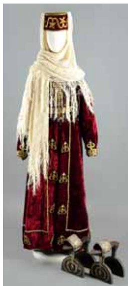
Рис. 4. Женский праздничный костюм. Карачаевцы. Кубанская область. Начало XX в. // РЭМ. 7147-1