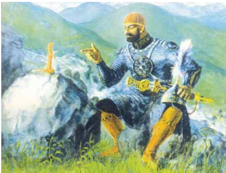
Рис. 1. Х.-А.А.-С. Имагожев. Беседа Соска Солса с лаской. Холст, масло. 1988 г.