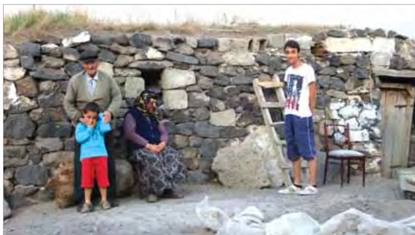
Семья туркмен-алевитов (С. Караджаёрен, провинция Карс, Турция)