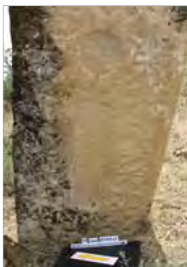
Рис. 11. Карчаг. Еврейское кладбище, надгробие с антропоморфным экраном