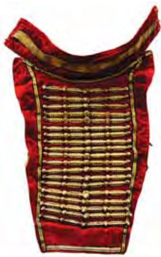
Рис. 3. Нагрудник. Карачаевцы. Балкарцы (?) // ДМИИ им. П.С. Гамзатовой (Махачкала). КП-5986, С-2397