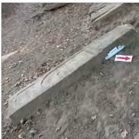
Рис. 9. Нюгди. Еврейское кладбище, надгробие