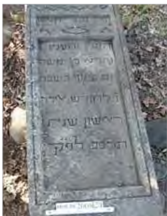
Рис. 8. Нюгди. Еврейское кладбище, надгробие