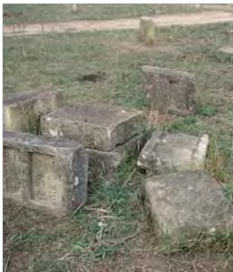
Рис. 7. Янгикент. Еврейское кладбище, участок с завалами