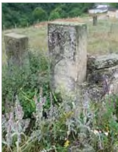
Рис. 5. Маджалис. Еврейское кладбище, общий вид