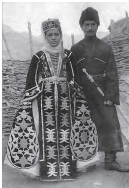
Рис. 6. Молодые в свадебных костюмах. Карачаевцы. Терская область. 1906 г.