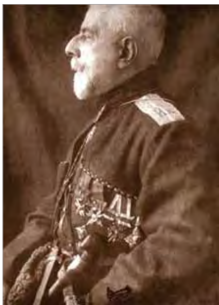
Рис. 3. Ивченко (Светлов) Валериан Яковлевич, ротмистр Ингушского конного полка КТКД. Редактор журнала «Нива», г. Петроград. Фото 1915 г.