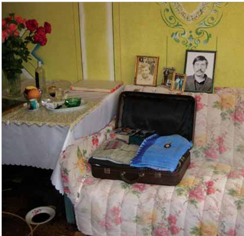
Рис. 1. Аншьян — место, где кладут вещи покойного и фотографии усопших близких родственников семьи