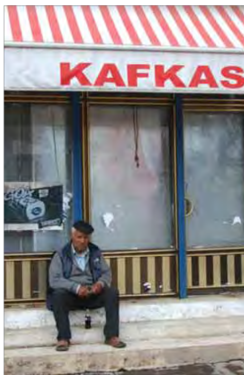
На улице г. Ак-Яка (провинция Карс, Турция)