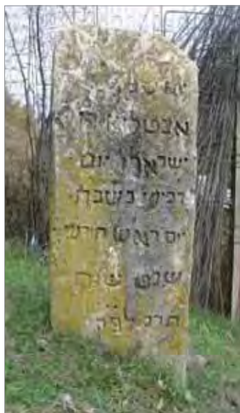
Рис. 6. Маджалис. Еврейское кладбище, надгробие 1842 г.