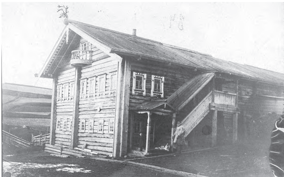
Рис. 7. Двухэтажный дом зажиточного крестьянина. На коньке дома олени рога. Колл. № 974-85

На снимке (рис. 7) запечатлен дом, как пишет Н.А. Шабунин, «сравнительно богатого крестьянина». Конек этого дома украшают олени рога. В иллюстративной коллекции имеется большое количество снимков, на которых