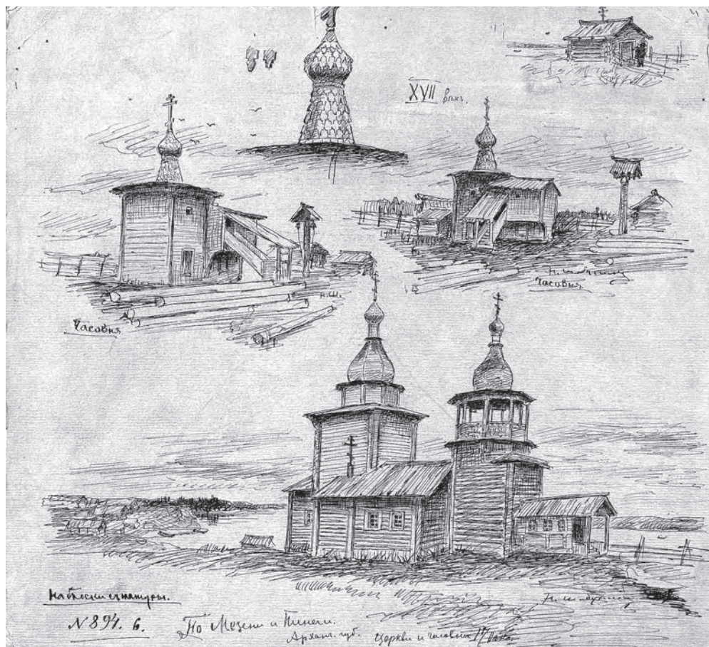
Рис. 2. Две часовни. Рисунок пером Н.А. Шабунина. МАЭ РАН. Колл. № 894-6

ровал, записывал, приобретал коллекции и для Русского музея Александра III, и для Общества архитекторов. Именно в Санкт-Петербургском обществе архитекторов Н.А. Шабунин впервые прочитал доклад «Северный край и его жизнь». Рукопись этого доклада была передана в Отделение русского языка и словесности ИАН. Впоследствии этот доклад был опубликован — «Северный край и его жизнь (путевые заметки и впечатления по северной части Архангельской губернии)». Сборник был издан уже после смерти Н.А. Шабунина. Предисловие к этому изданию было написано академиком Императорской академии наук Н.П. Кондаковым [Шабунин 1908].