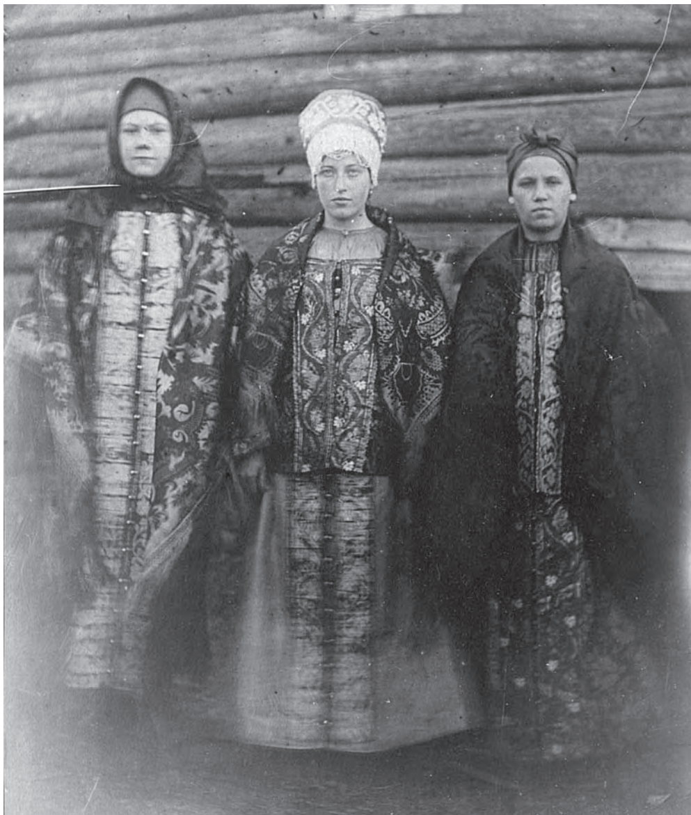
Рис. 5. Крестьянки в душегрейке (коротеньке) и шубейке. МАЭ РАН. Колл. № 974-52

№ 893-14 — «коротенька из красного штофа с затканными золотой нитью цветами. Спереди по бортам нашит золотой позумент, сзади, между ляжками — то же, на ляжках нашит узкий позумент. Борта застегивались при помощи крючков и петель (металлических). Края коротеньки, перед до лямок, внутренние края лямок и спинная часть между ними обшиты узкой полоской темно-малинового шелка. Наружная сторона лямок и подмышечная часть обшиты серым материалом. Подкладка коротеньки сшита из ситца в красную точечку».