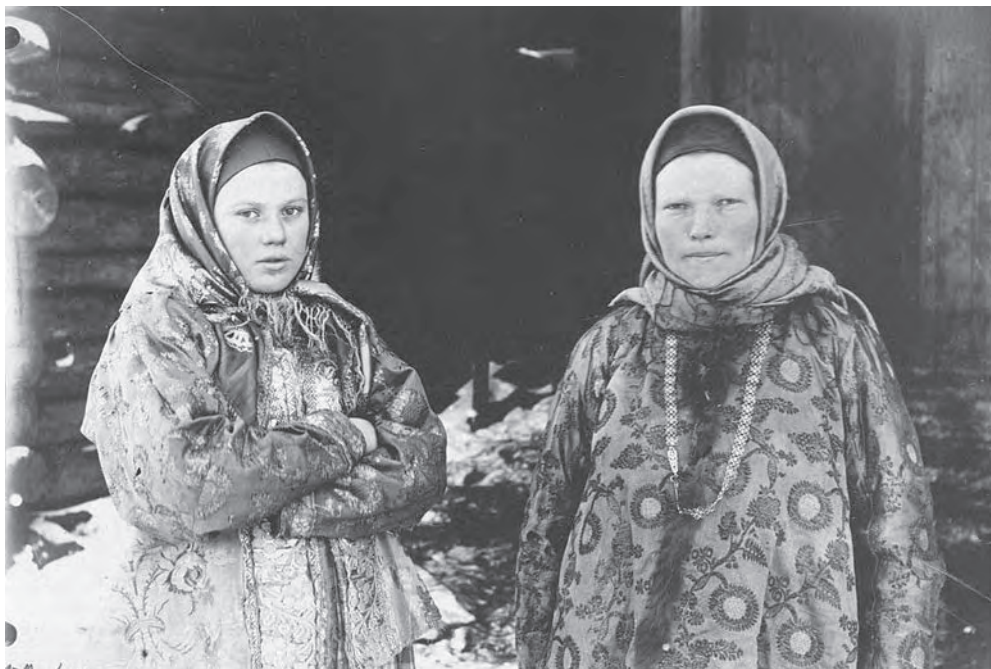
Рис. 6. Платки носили и на голове, закрепив их под подбородком. Молодая замужняя женщина. МАЭ РАН. Колл. № 974-62

бит холстом. Древность — поколение 3-е, носится и ныне. Русские. Мезенский край».