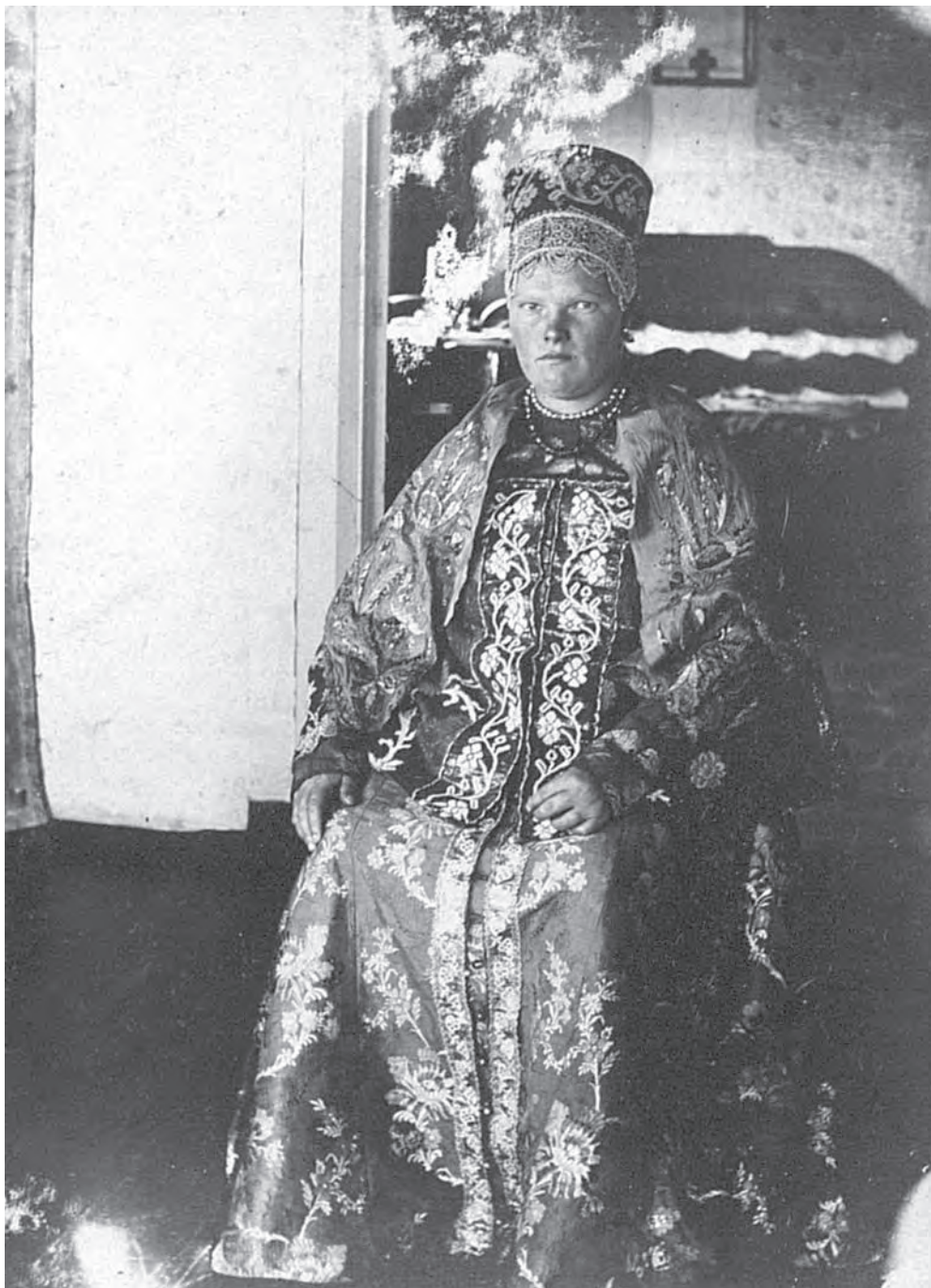
Рис. 4. Наряд для хоровода и венчания. МАЭ РАН. Колл. № 974-54

обшит узкой тесьмой с красным орнаментом. Края бортов обшиты красным шнурком, к которому с одной стороны пришиты 5 пуговиц, а с другой — из того шнура сделаны петли».