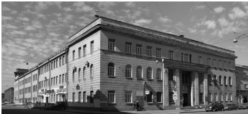
Рис. 7. Здание типографии на Звенигородской ул., д. 11. 2000 г.

Фирме удалось привлечь к работе художников «Мира искусства», известного в России в 1898–1927 гг. художественного объединения. В объединение входили молодые художники А. Бенуа, С. Дягилев, Д. Философов и другие интеллектуалы, увлеченные поиском идеалов в искусстве прошлого, главным образом XVIII — начала XIX в. Работа с мирискусниками позволила «Голике и Вильборг» издавать книги на отличном полиграфическом уровне. Выходили подарочные фолианты, книги к знаменательным датам (100-летие начала Отечественной войны 1812 г., 200-летие Санкт-