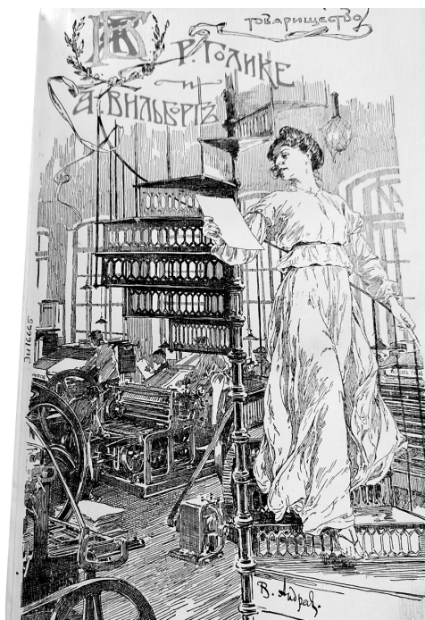
Рис. 4. Реклама типографии Голике и Вильборга

В 1902 г. предприниматели Р. Голике и А. Вильборг объединили свои типографии (рис. 4), а через два года, 10 октября 1904 г., «открыла свои действия» ссудно-сберегательная касса служащих 48 . Первоначально в кассу вступили 124 человека, через 10 лет в кас-