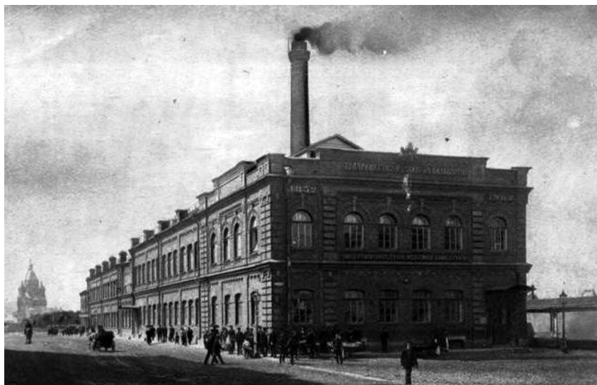
Рис. 6. Здание типографии на Звенигородской ул. 1903 г.