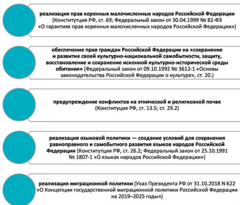
Рис. 4. Возможные предметы правового регулирования этнологической экспертизы

регламентации. В качестве примера можно привести следующий ряд предметов правового регулирования (рис. 4) 344 .