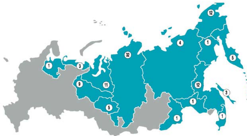
Рис. 3. Частота упоминаний этнических групп в докладных записках (1956–1994)

они очень тяжелы для перевозки, пластмассовые крепления быстро ломаются и т. д.» 131 .