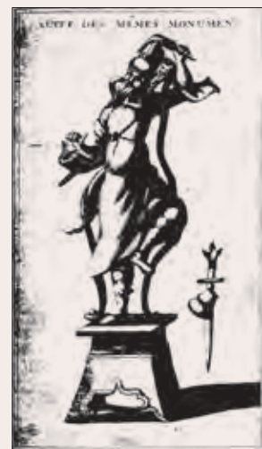
Рис. 8. Изображение даосского святого из коллекции И. М. Лихарева (Montfaucon. Supplement ). Китай, VIII–IX вв. (см.: Княжецкая. «Новые сведения». С. 30–32). Приобретено в начале XVIII в. на Рудном Алтае