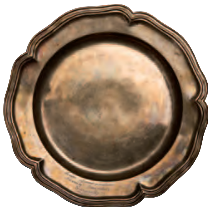
Серебряное блюдо. Россия. XVIII в.