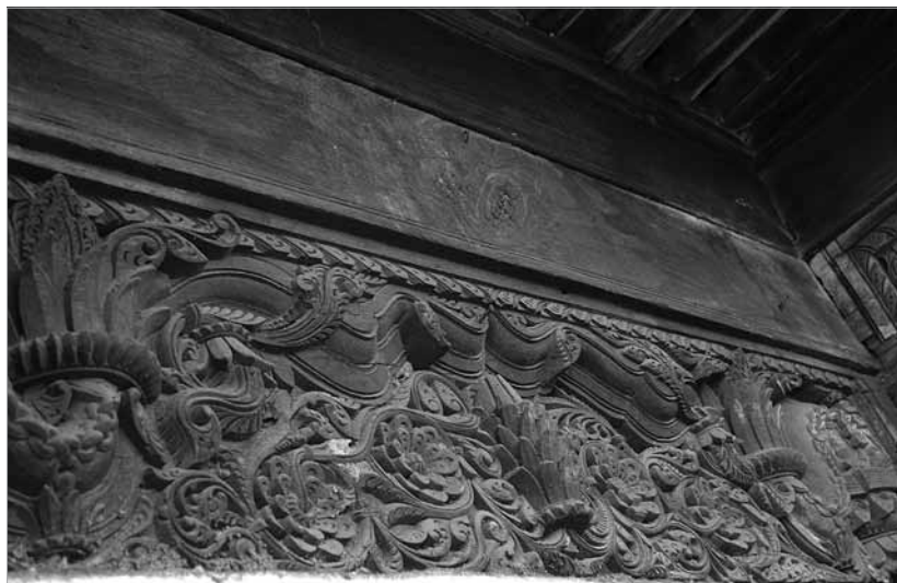
Рис. 50–57. Усадьба Вара в г. Насик. 2015