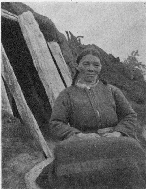
Рис. 3. Лапландская женщина съ типичной формой головы. (Изъ Idre, Dalarne).

лежить въ своей люлькѣ, перевязанный, почти неподвижно, но все-таки никакихъ мѣръ не принимается для того, чтобы прикрѣпить его голову къ люлькѣ. Постоянное лежачее положеніе лапландскихъ дѣтей могло лишь вызвать плоскватость затылочной части головы; въ особенности это случилось часто въ прежнія времена, когда лапландцы не подкладывали подъ голову ребенка маленькой подушки, какъ это дѣлается теперь. Старая лапландка въ Вестерботтенѣ (Westerbotten) рассказывала, что «въ прежнія времена дѣти большею частью были съ плоской затылочной частью головы, потому что долгое время лежали въ «kiertkama», т. - е. въ лапландской люлькѣ». На эту непреднамеренную деформацию головы у южныхъ лапландцевъ уже въ 1742 г. было указано превосходнымъ наблюдателемъ майоромъ Шнитлеромъ (Schnitler. — Det norske Geografiske Selskabs. Aarbog I, стр. 51). Онъ говоритъ по этому поводу слѣдующее: «Обычно находятъ, что лапландцы имѣютъ плоскую затылочную часть головы...; это происходитъ отъ того, что дѣтей укладываютъ на твердую доску безъ подушки, причемъ подстилаютъ имъ лишь тонкую кожу молодого оленя».