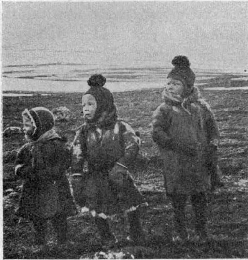
Рис. 2. Лапландскія дѣти: одна дѣвочка и два мальчика съ капками на головахъ. Капка для мальчика всегда украшена наверху красной кисточкой.

Лапландскія дѣти должны были носить капку, не снимая, днем и ночью, и, вѣроятно, она дѣйствительно вліяла на измѣненіе формы головы у дѣтей. Во всякомъ случаѣ, этого мнѣнія придерживаются сами лапландцы.