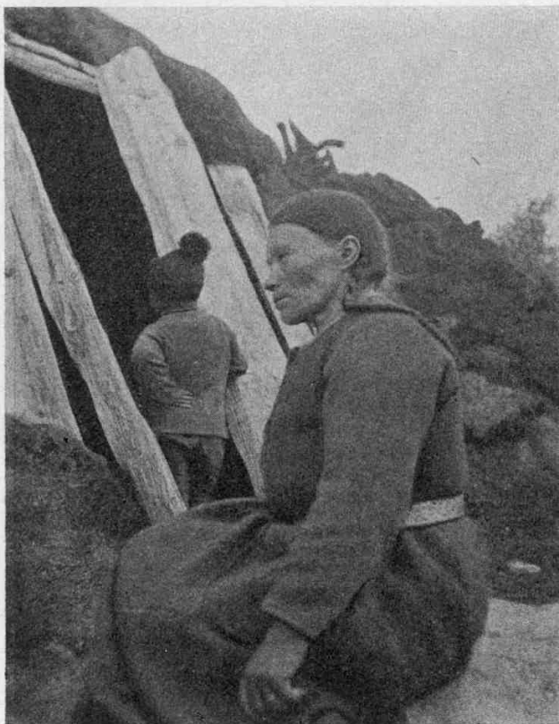
Рис. 4. Та же женщина, снятая въ профиль.

По моему мнѣнію, нѣтъ ничего невѣроятнаго въ томъ, что обычай формованія головы мы можемъ встрѣтить и у другихъ финно-угорскихъ народовъ, какъ, напр., у самоѣдовъ и остяковъ, по это покажутъ будущія изслѣдованія.