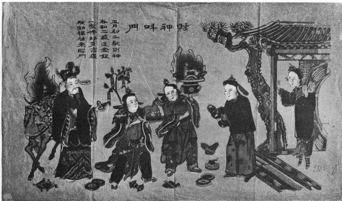
Прибытіе бога богатства.