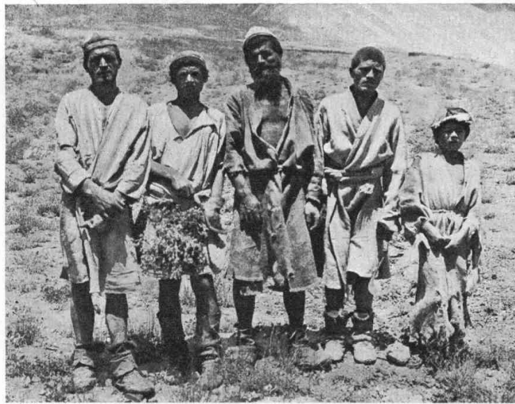
Группа таджиковъ изъ сел. Орошоръ на Бартангѣ.