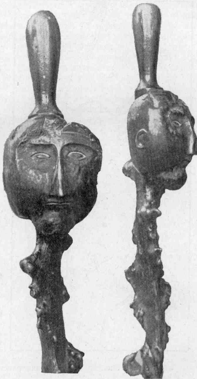
Рис. 2. Палка «паданского короля» в фас и профиль (КГМ, № 264/18-3).

Первый из них отличается от обычных посохов патьвашки тем, что в верхней его части на крупном наросте вырезано человеческое лицо. Длина палки вместе с приделанной к ней точеной рукояткой — 122 см. По преданиям, палка сохранилась от так называемого «паданского короля», каковым, вероятнее всего, мог являться какой-нибудь авторитетный колдун или даже старейшина рода. Посох был доставлен в бывший Олонецкий музей управ-