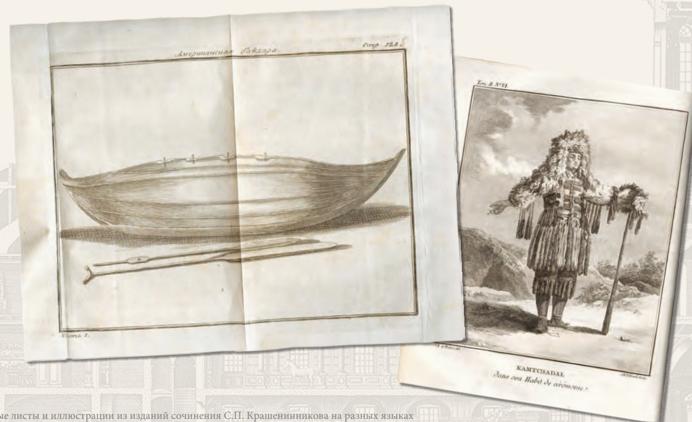
Титульные листы и иллюстрации из изданий сочинения С.П. Крашенинникова на разных языках